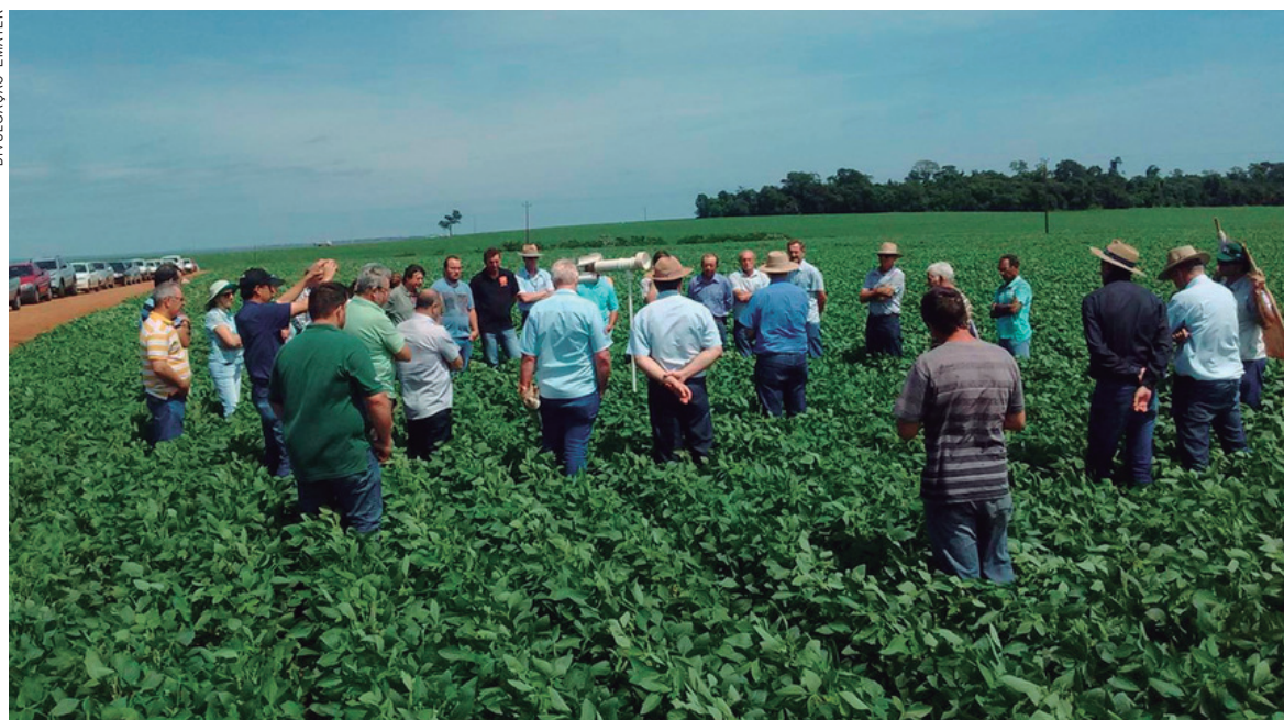
Técnicos da Emater vão a campo para orientar produtores