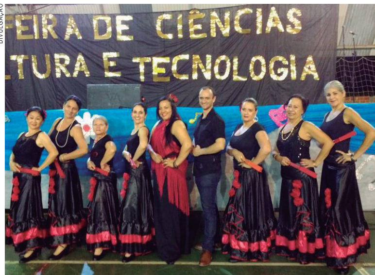
Grupo Arte Flamenca Senior e a professora de espanhol e o diretor da escola ao centro

De acordo com as integrantes do grupo de senhoras, a experiência de expor a dança para uma comunidade é sempre gratificante. "Gostei muito de me