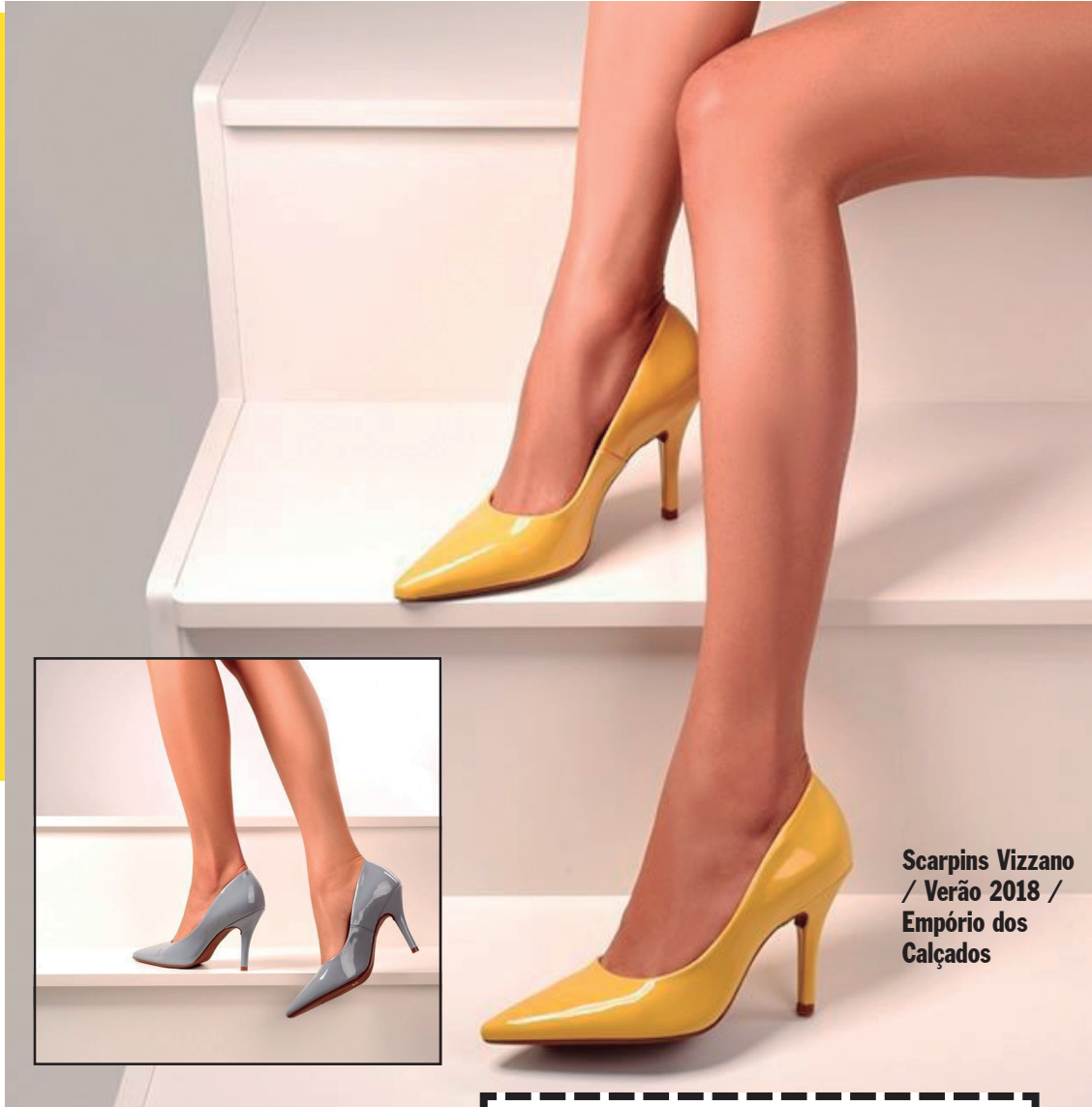
Scarpins Vizzano / Verão 2018 / Empório dos Calçados