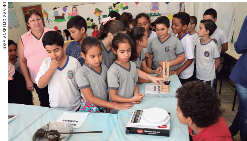
As crianças participaram com interesse do evento

A mostra cultura contou com os seguintes temas, expostos e bem explicados pelos alunos, em cenários montados para apresentações nas respectivas salas de aula: brincando, cantando e aprendendo matemática; descobrindo as formas geométricas;