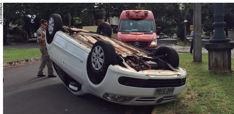
Gol ficou capotado com as rodas para o alto por causa da colisão que aconteceu na região central da cidade

O empresário Jair Aparecido Biato, de 63 anos, conduzia seu Volkswagen Voyage pela rua Ara-