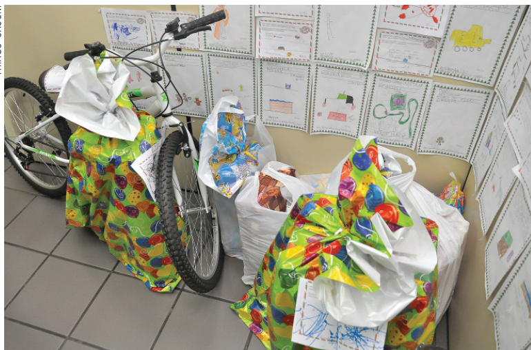
Ainda há cartinhas nos correios para serem adotadas, mas já tem voluntários levando presentes

Como de costume, as cartinhas são escritas por crianças que estão no ensino fundamental com supervisão dos professores. Os presentes serão entregues no último dia do ano letivo, 15 de dezembro.