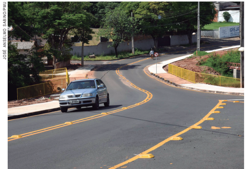
A construção da ponte trouxe mais segurança para os pedestres