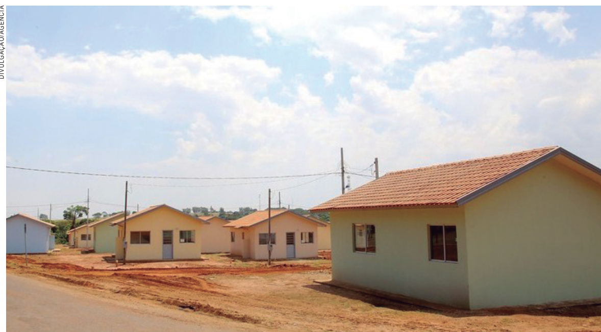
Prefeituras devem disponibilizar o terreno para o projeto

O Programa Integrado de Inclusão Social e Requalificação Urbana – Família Paranaense oferta uma rede de serviços para as famílias em vulnerabilidade social.