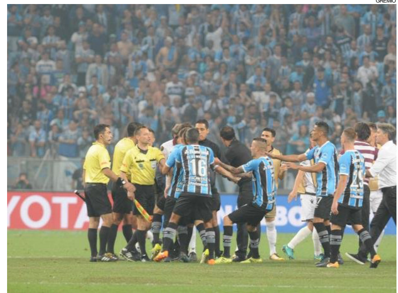
Nem vitória tirou o sentimento de injustiça para os gremistas

"Meu sentimento é de ter sido roubado. O Grêmio foi roubado. Arbitragem trancada, que apitava tudo e descriteriosa na aplicação dos cartões, faltas. Incompetente e prejudicial na avaliação das penalidades máximas. Sentimento de indignação, de ter sido furtado. De ter visto o campeonato ser colocado em dúvida. Indignação absoluta. Nós vamos tomar providências. Estou examinando quais serão. Já manifestamos indignação pessoal, já falei com nossos advogados. Parece que nem teve vitória pelo sentimento de injustiça que