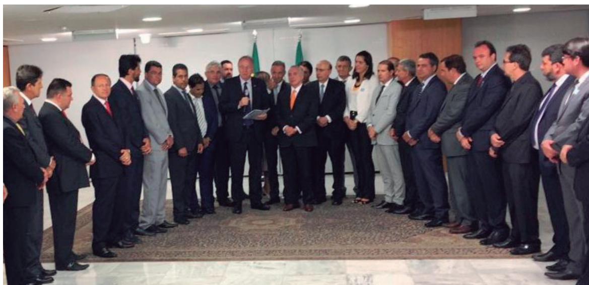
Dirigentes da CNM, com o presidente Temer, garantem mais recursos para os municípios

O movimento municipalista viveu um dia histórico nesta terça-feira (dia 22), em Brasília, na mobilização nacional das prefeituras promovida pela CNM (Confederação Nacional dos Municípios), com o apoio da AMP (Associação dos Municípios do Paraná).