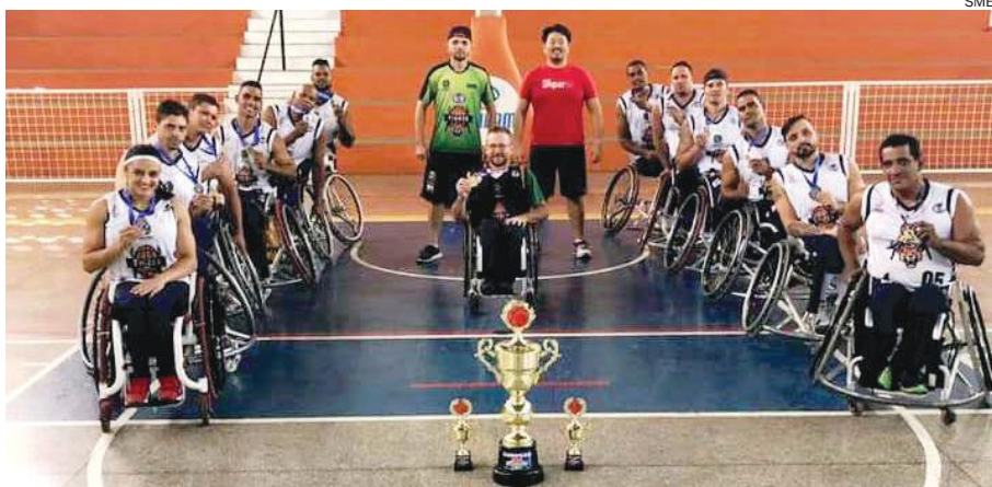
ESTA é a primeira vez que a equipe Tigres participam da competição em Minas Gerais

Na decisão do título o Tigres bateu o time principal da casa, o Unipam A, por 63x52. “A final foi muito equilibrada. Conseguimos jogar bem de início, mas no final do jogo o time da casa pressionou