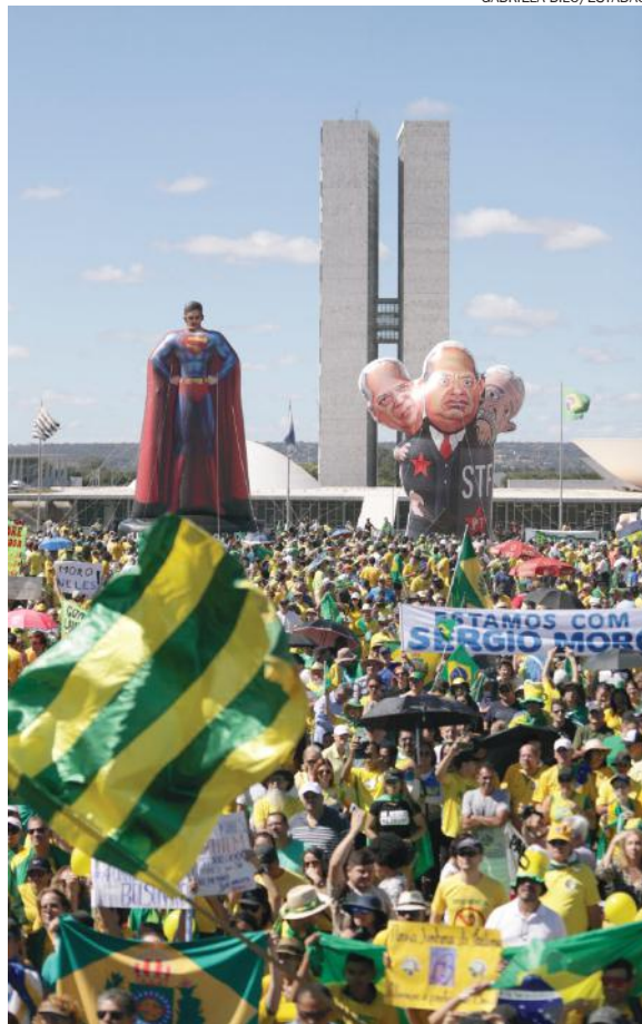
MANIFESTANTES levaram bonecos infláveis de Moro (de Superman) e Lula, o ex-ministro do PT José Dirceu e o ministro Gilmar Mendes, do STF

“Quem vem pro Supremo Tribunal Federal, quem se torna ministro do STF, ele está absolutamente, todos aqui têm couro suficiente para aguentar qualquer tipo de crítica e pressão”, disse Toffoli a jornalistas, ao participar de brunch com a imprensa para um balanço do primeiro semestre. “Eu não me impressiono. Quem vem para cá tem couro e tem de aguentar qualquer tipo de crítica. O próprio processo de sabatina (no Senado, onde os indicados pelo presidente da República a uma vaga no STF são sabatinados e precisam ganhar aval dos senadores) é um bom teste para isso”.