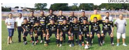
A disputa pela final acontece no domingo (7), no Lúcio Pipino

Já o Guarani foi venceu a primeira partida contra o Paiçandu por WO – quando a equipe não se apresenta com o máximo, ou o mínimo de jogadores para a partida –, e no jogo de