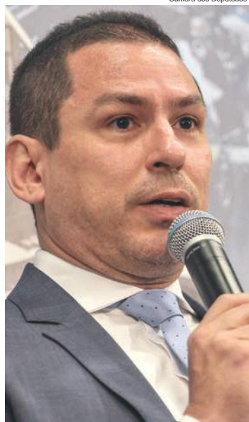
Câmara dos Deputados

(Envie sua opinião com até 1.200 caracteres para editoria@jhoje.com.br)