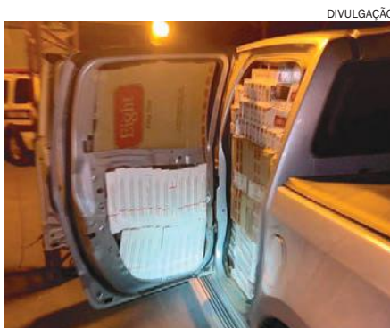
CAMINHONETE repleta de cigarros contrabandeados foi apreendida na ação

Quando os policiais tentaram prender o umuaramense ele resistiu