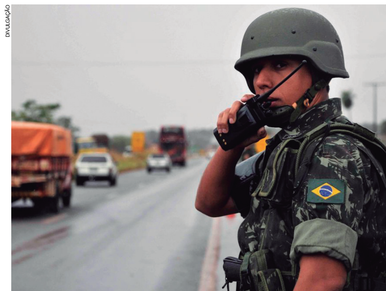
Tropas foram alojadas no noroeste e deram início às ações na região de fronteira logo pela manhã de ontem (20)

Os resultados do primeiro dia de ações não haviam sido divulgados até o fechamento desta edição.