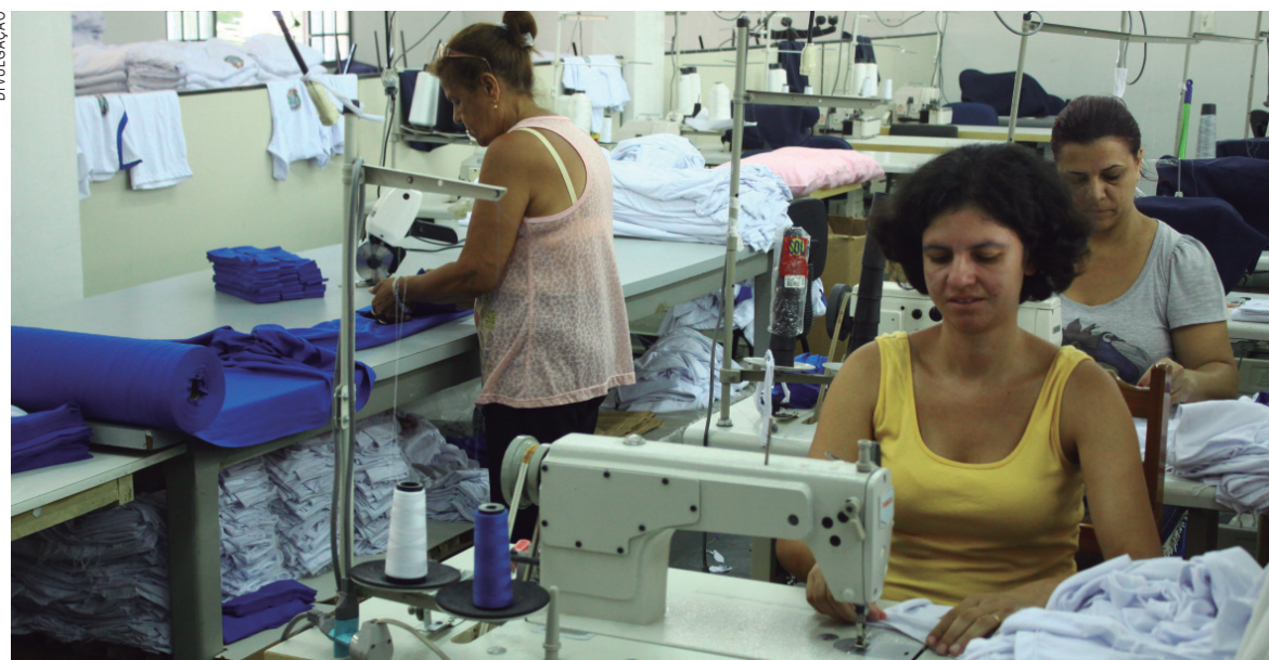
Setor Textil é um dos grandes geradores de empregos no Paraná

O saldo de empregos formais no Brasil atingiu o melhor resultado deste ano, com a abertura de 76.599 novas vagas no mês de outubro. Segundo o Cadastro Geral de Empregados e Desempregados (Caged), divulgado nesta segunda-feira (20) pelo Ministério do Trabalho (MTb), foram registradas 1.187.819 admissões e 1.111.220 demissões no mês passado.