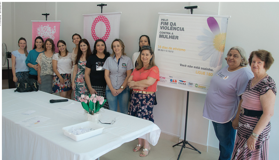
As conselheiras municipais definiram programação para conscientizar a população