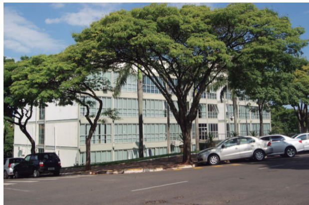
ARQUIVO TRIBUNA HOJE

Em virtude do feriado nacional da Proclamação da República (15/11), a Prefeitura de Umuarama informa que hoje (15) não haverá expediente de trabalho nos órgãos públicos municipais da administração direta e indireta, com exceção dos serviços essenciais que, por sua natureza não possam sofrer paralisação. Permanecerão funcionando os departamentos de Vigilância em Saúde, serviços funerários, varrição, coleta de lixo e a Guarda Municipal. As aulas nos CMEIs voltarão ao atendimento normal na quinta-feira, 16. O mesmo ocorrerá nas Unidades Básicas de Saúde (UBS). O Pronto Atendimento Municipal funcionará normalmente – das 7h às 23h – para os casos de urgência e emergência. Para os casos mais graves, o hospital de plantão neste feriado é o Uopeccan. Os mercados Hiper e Big da rede Planalto também os Vivian ficarão abertos das 8h às 12h. Já o Cidade Canção estende o horário para 20h. O comércio e os bancos não abrem neste feriado.