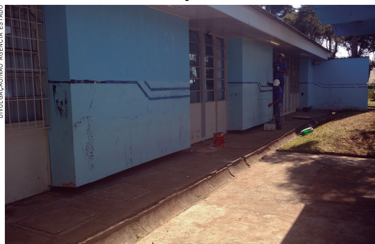
Presos trabalham em melhorias nos prédios escolares