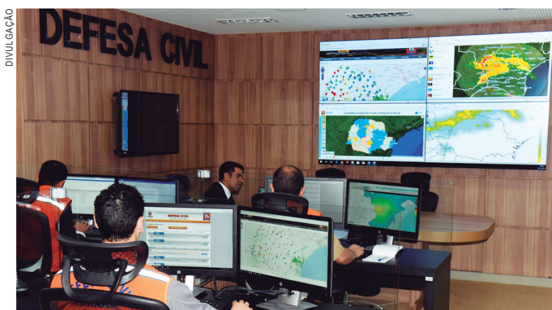
A Coordenadoria Estadual de Proteção e Defesa Civil faz o monitoramento da situação em todos os municípios

Todas as cidades possuem plano municipal de contingência de proteção e defesa civil e