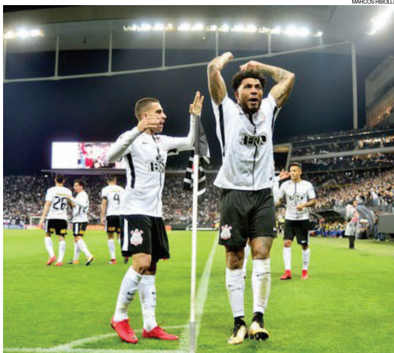
Com 68 pontos na tabela, Corinthians joga hoje contra o Fluminense