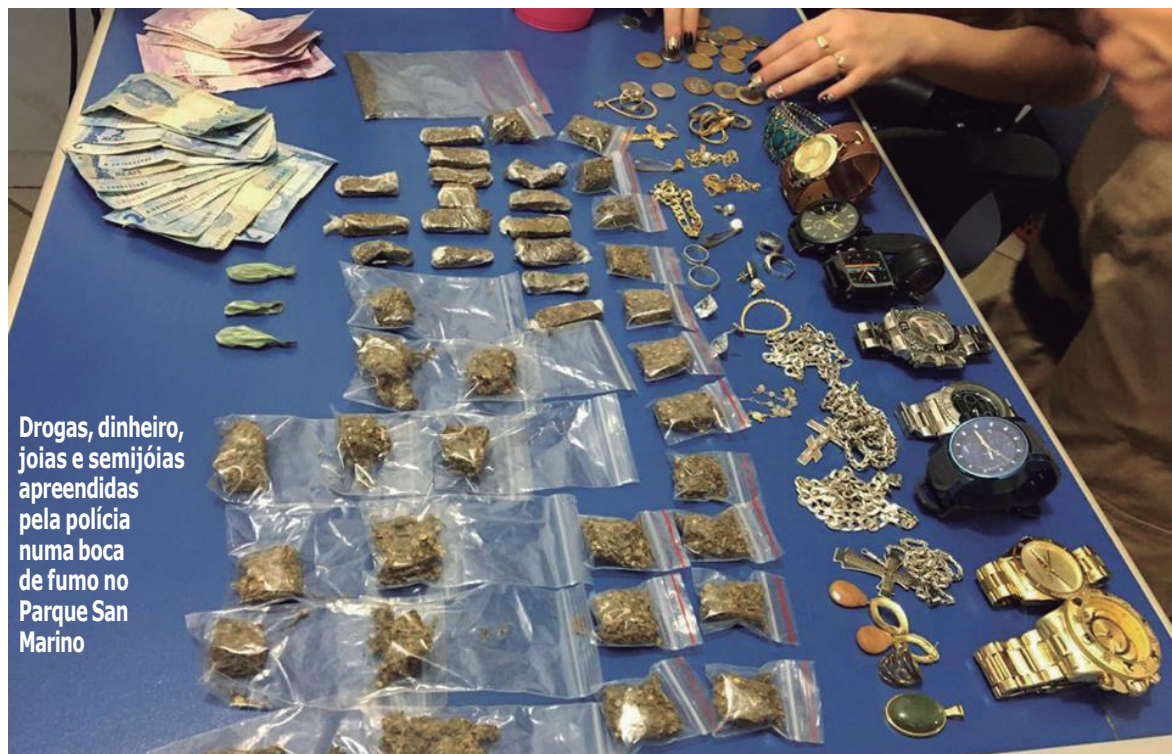
Drogas, dinheiro, joias e semijoias apreendidas pela polícia numa boca de fumo no Parque San Marino

O furto de uma bicicleta levou a Polícia Militar de Umuarama à descoberta de uma 'boca de fumo' no Parque San Marino, ao final da tarde de segunda-feira. O autor do furto da bicicleta foi monitorado e localizado, e, ao ser abordado, confessou ter trocado o produto por drogas e levou os PMs até o endereço, onde foram apreendidas drogas, joias e semijoias.