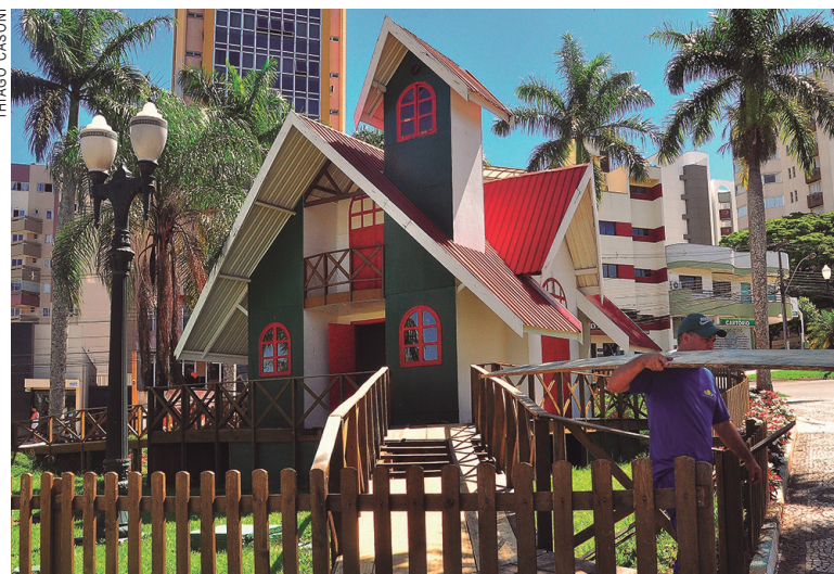
Funcionários da Prefeitura,, trabalhando nos preparativos da Casa do Papai Noel

Nesta semana, funcionários da prefeitura de Umuarama trabalhavam na reforma da Casinha do Papai Noel, localizada no interior da Praça Henio Romagnoli. São os últimos detalhes de toda uma preparação, visando as festividades de final de ano. As atividades não ficarão concentradas apenas na Praça do Papai Noel, mas o local, por tradição, é um dos mais frequentados pelas famílias durante o período natalino. Prefeitura e Associação Comercial trabalham em conjunto nos preparativos, assim como, na programação, que já está pronta e será divulgada na sexta-feira.