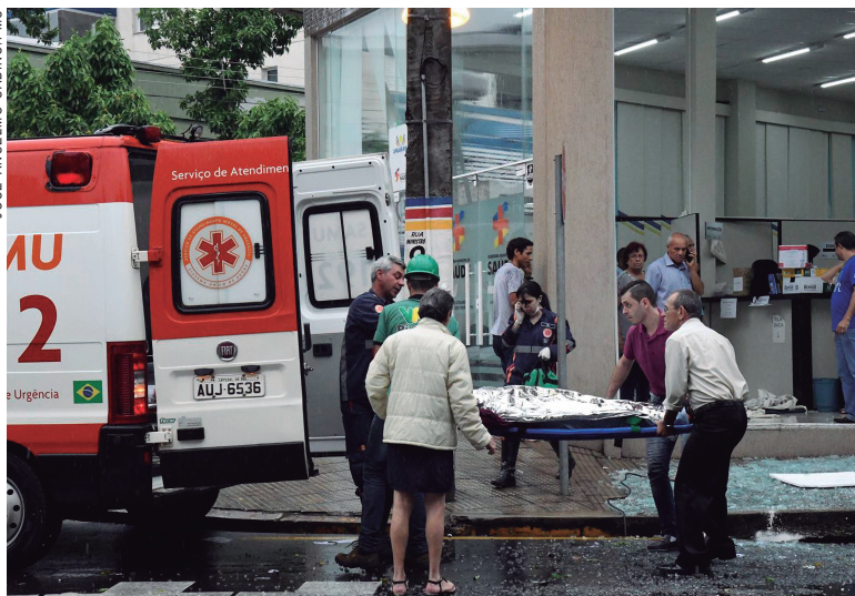
Funcionários tiveram que ser atendidos, mas com ferimentos leves

Após a chuva, a Prefeitura providenciou tapumes de madeira para proteger a estrutura da secretaria e na próxima segunda-feira o trabalho será apenas interno. Três funcionários da Secretaria da Saúde foram atin-