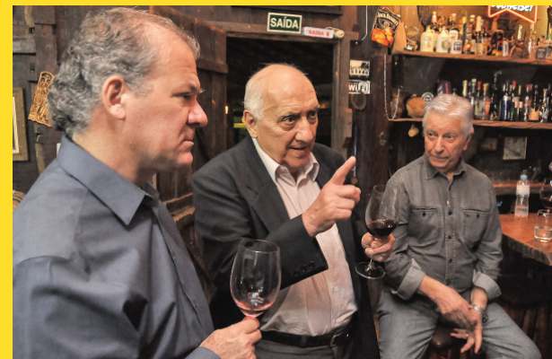
DISCURSOS e muito bate papo descontraído