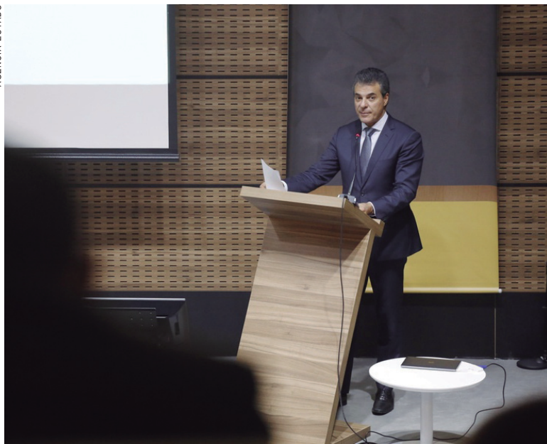
Governador Beto Richa falou dos investimentos do Estado para 2018

Em 2017, o investimento total, somadas todas as áreas, chegará a R$ 7,8 bilhões. A projeção para 2018 inclui os aportes da Copel e da Sanepar. O projeto orçamentário para o ano que vem está em tramitação na As-