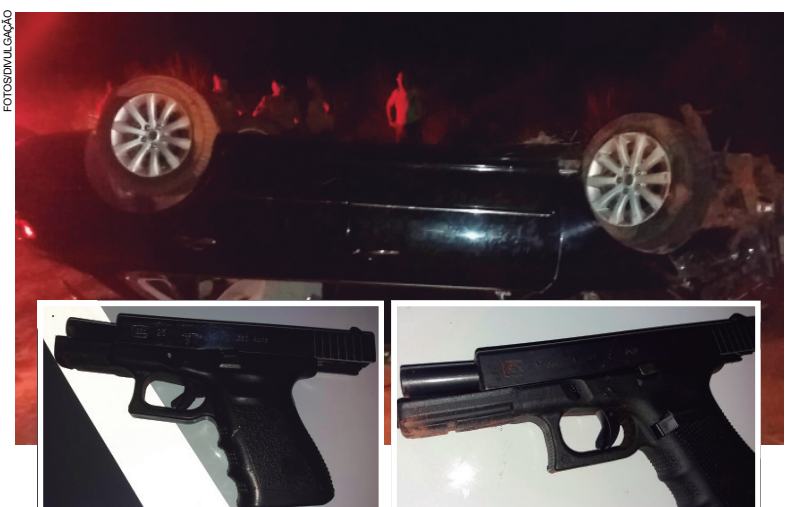
Carro capotado tinha alerta de roubo e perto do veículo foram encontradas as duas pistolas, também apreendidas

Ao chegarem ao local, verificaram que haviam duas pistolas caídas perto dos veículos mas os ocupantes não estavam ali. Quando o apoio chegou, novas buscas foram iniciadas até que dois suspeitos foram localizados. Estavam com ferimentos decor-