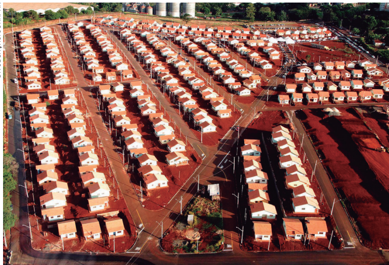
As casas serão construídas de acordo com padrão da Cohapar

par, com 2.089 casas e apartamentos em Cascavel, no fim de setembro, com a presença do ministro das Cidades, Bruno Araújo. "A parceria com o governo federal, que agora se afina, é de respeito, de trabalho, e beneficia todos os municípios do Paraná".