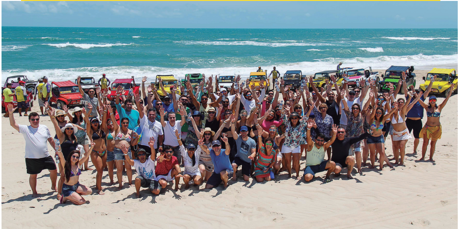
Os participantes do evento na paradisíaca praia, em Fortaleza