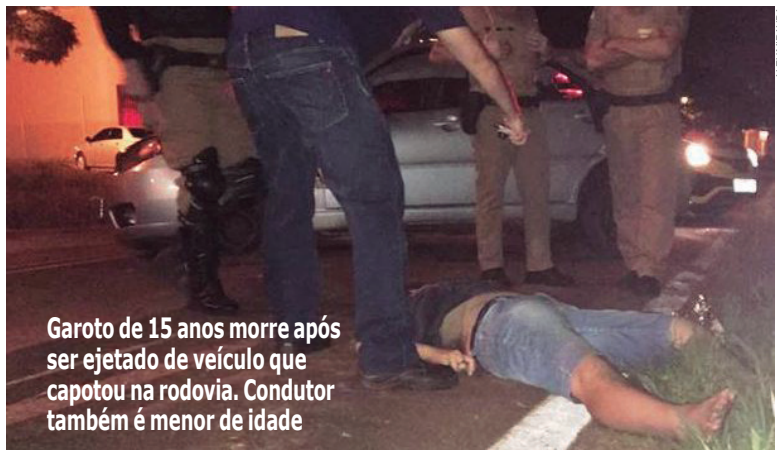
Garoto de 15 anos morre após ser ejetado de veículo que capotou na rodovia. Condutor também é menor de idade

Depois de submeter um adolescente de 17 anos ao exame do bafômetro, policiais militares de Umuarama constataram que o garoto estava embriagado, quando se envolveu num acidente de trânsito na Alameda dos Bandeirantes, durante a madrugada de