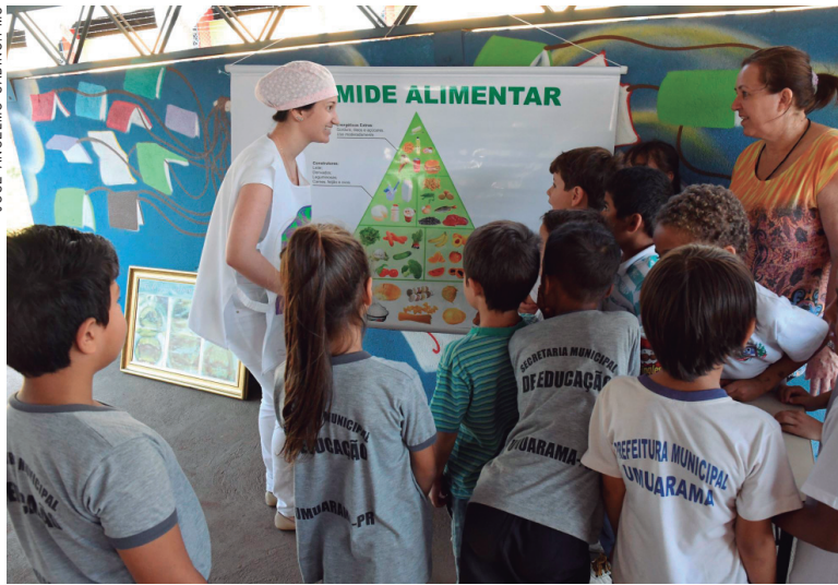
Projeto sendo realizado na Escola Municipal São Francisco, no Jardim Alphaville