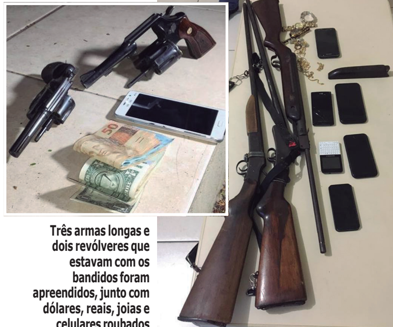
Três armas longas e dois revólveres que estavam com os bandidos foram apreendidos, junto com dólares, reais, joias e celulares roubados

"Nós estávamos dormindo, quando ouvimos o barulho dos tiros. Eu olhei pela janela e vi uma lanterna, abracei minha esposa e meu filho e deitamos todos debaixo da cama. Quando falou que era policial, fiquei mais aliviado e depois ouvi mais tiros e um invasor morto na cozinha da minha