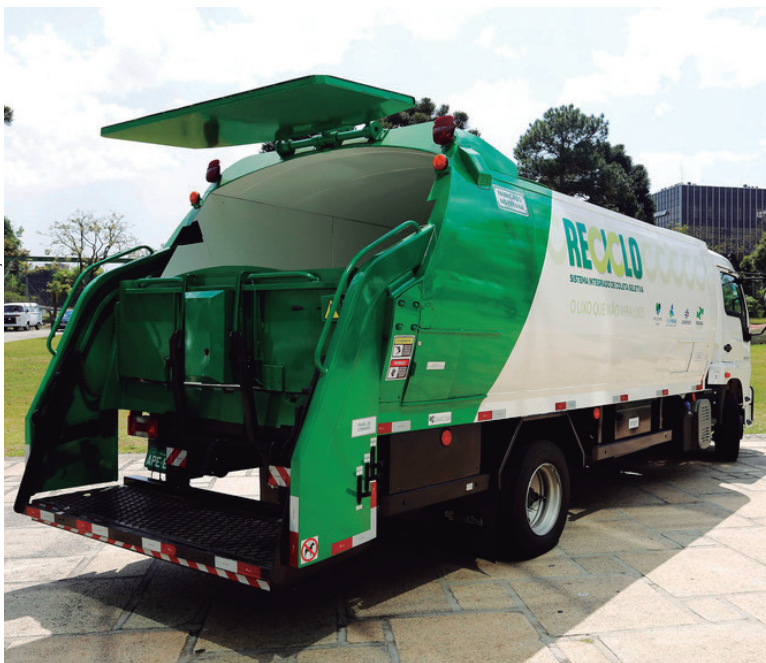
Programa beneficia municípios na coleta seletiva

de conscientização junto à população para a separação diária do lixo.