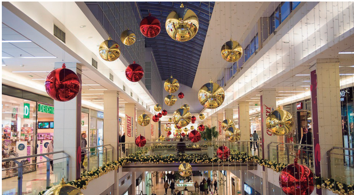
Produtos de natal podem sair mais caros

Com as festas de Natal chegando, o consumidor pode pagar por volta de 48% de impostos em cima de enfeites para a tradicional árvore. O peru ou o chester também podem ficar mais caros para quem quer incrementar a ceia no fim do ano. O valor dos impostos em cima das aves pode chegar a 30%. E para quem já quer começar a pesquisar os preços do material escolar, fique de olho, pois o valor de livros didáticos pode ter tributação de mais de 15% em cima do produto, assim como o caderno, que pode chegar a subir 40%, segundo dados do Instituto Brasileiro de