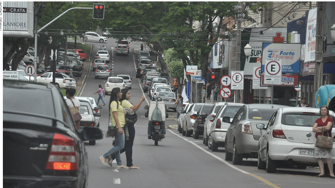
Pedestres fora da faixa, serão abordados e multados. Mas os departamentos de trânsito ainda não sabem como operacionalizar o serviço

Nacionalmente, a medida começa a valer em 180 dias, conforme determina a Resolução normativa. Mas segundo Dianês, a lei apresenta falhas que precisam ser corrigidas. "Precisamos que as vias tenham condições para que se cobre isso. Hoje somente a área central tem fai-