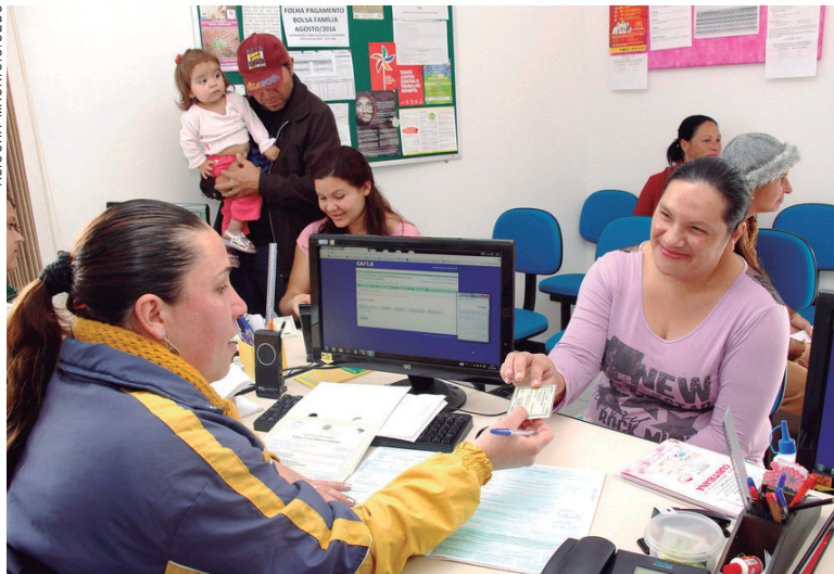
Famílias recebem apoio através do Família Paranaense

O Incentivo Família Paranaense prevê o cofinanciamento aos municípios para apoiar a implementação das ações. A modali-