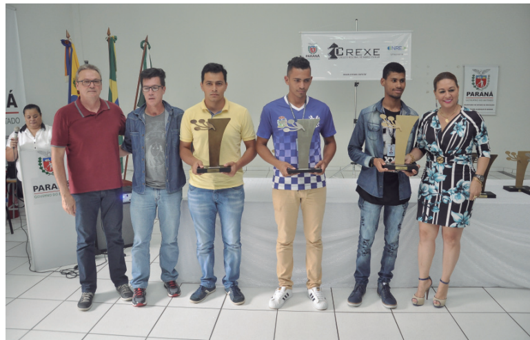
Os troféus, entregues aos destaques do Xadrez regional