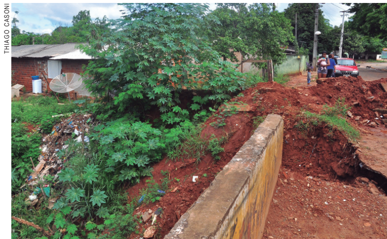
Erosão avança e prefeitura quer retirada de casas em área de risco

As chuvas não deram tempo para a prefeitura de Umuarama e já provocaram um princípio de erosão na ponte, deixando moradores preocupados. A Secretaria de Obras já está com o projeto pronto para a construção de uma nova ponte sobre o córrego Pinhalzinho, no Parque Laranjeiras, porém não é possível prever o início da obra. O município aguarda a liberação de vigas de concreto pelo Departamento de Estradas de Rodagem (DER). A ponte continuará interdita nos próximos