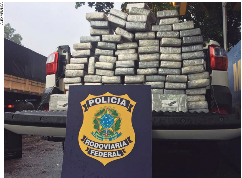
Droga apreendida foi avaliada em R$ 3 milhões e seria entregue em frente à prefeitura de Umuarama