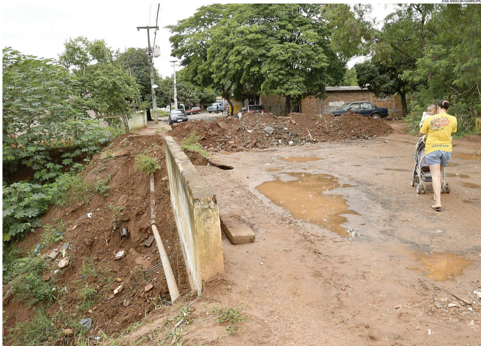
JOSE ANSELMO SABINO/PMU

Famílias que estão morando às margens do rio Pinhalzinho, no Parque Laranjeiras, terão que ser retiradas do local, para que a Prefeitura possa realizar um serviço definitivo de recuperação da ponte, danificada neste final de semana devido às fortes chuvas. O engenheiro Issamu Oshima, secretário de Obras da Prefeitura, diz que é preciso devolver o córrego ao seu leito natural.