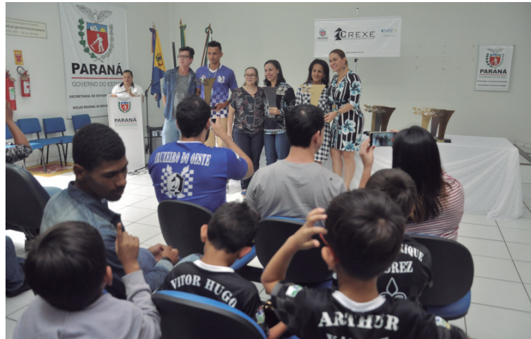
Estudantes vieram da região para receber medalhas e troféus