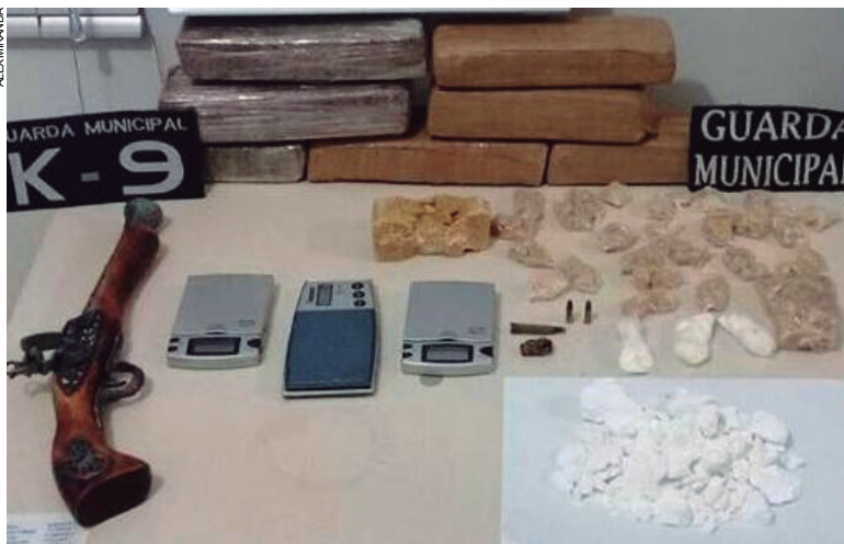
Toda a droga apreendida foi avaliada em cerca de 20 mil reais

de maconha, mais de meio quilo de crack e cerca de 300 gramas de cocaína. Se comercializada no varejo, toda a droga encontrada renderia cerca de R$ 20 mil