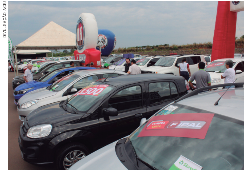
Cerca de 60 automóveis foram comercializados nos três dias de Feirão