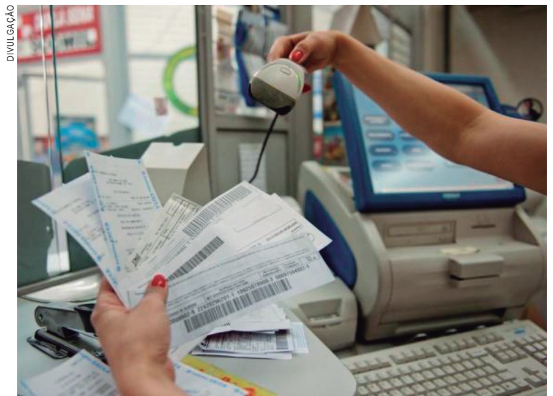
A novidade estava prevista para entrar em vigor ontem, mas agora passará a valer em 2018

Quando o consumidor fizer o pagamento, será feita uma consulta à nova plataforma para checar as informações. Se os dados do boleto coincidirem com os que estão no sistema a ser implantado, a operação é validada. Se houver divergência, o pagamento do boleto não será autorizado e o consumidor poderá realizar o pagamento exclusivamente no banco que emitiu a cobrança, que tem condições de fazer as checagens necessárias, diz a entidade.