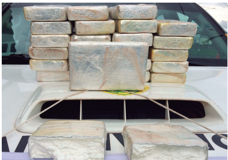
Droga apreendida com o trio, depois de fracionada, poderia render aos traficantes cerca de R$ 1 milhão

A Polícia Rodoviária apreendeu na tarde do domingo (08), mais de 25 quilos de cocaína, em um veículo que foi abordado no posto da Polícia Rodoviária de Cianorte, na PR-323. Dois homens e uma mulher foram presos em flagrante, na ocasião da apreensão, por volta das 13h30.