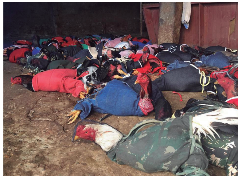
De acordo com os organizadores do evento, alguns 'galos de briga' chegam a ser avaliados em até R$ 20 mil

De acordo com o comandante da Operação, tenente Alcimar Crescêncio, esta foi a terceira detenção do organizador da