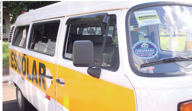
O transporte escolar deve ter acessórios de segurança adequados às crianças que estão sendo transportadas