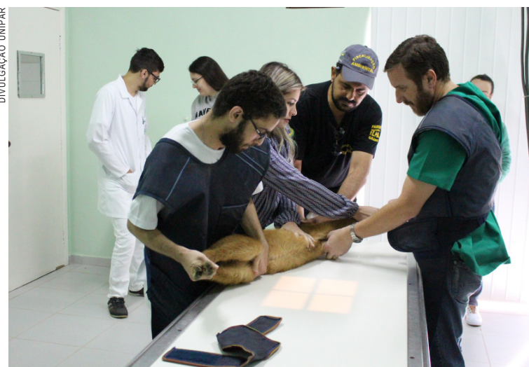
Cervo em atendimento no Hospital Veterinário