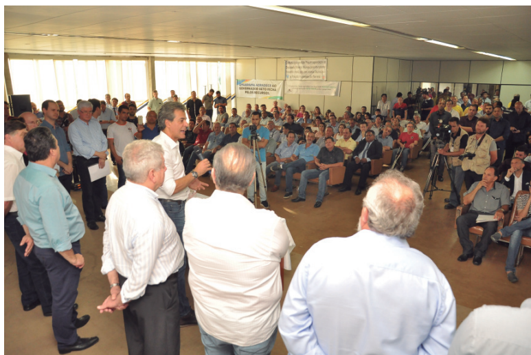
O governador Beto Richa foi recepcionado no anfiteatro da Prefeitura de Umuarama