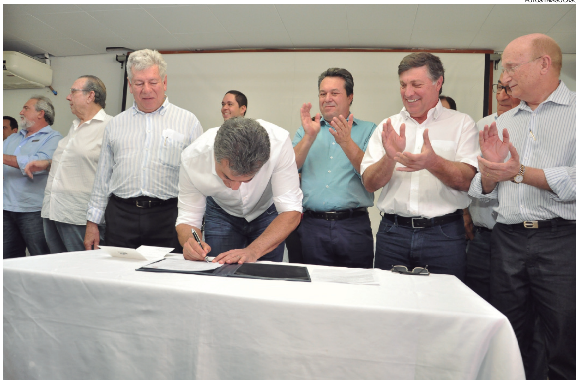
Governador ao lado de autoridade assinando a liberação de recursos

Serão destinados R$ 6,6 milhões para obras no aeroporto de Umuarama. Entre as obras previstas no local estão o recapeamento e a ampliação da pista. "As melhorias garantirão que o aeroporto possa receber voos comerciais. Acertamos