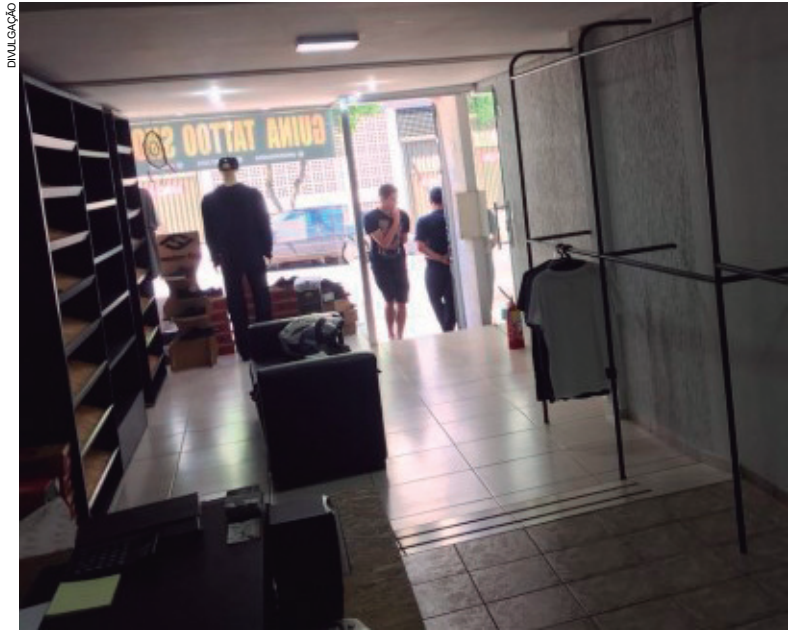
Araras no interior da loja ficaram vazias depois que um verdadeiro 'limpa' foi feito por ladrões durante a madrugada