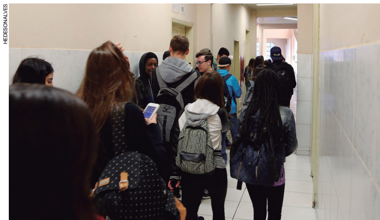
Secretaria da Educação definiu o cronograma de matrículas e rematrículas na rede estadual para o ano letivo de 2018

A carta-matrícula será entregue aos alunos do 5º ano e do 9º ano do ensino fundamental entre os dias 27 de novembro e 1º de dezembro. Ela contém a instituição de ensino para a qual o aluno está sendo direcionado, de acordo com a proximidade de sua residência e disponibilidade de vagas, entre outros critérios.