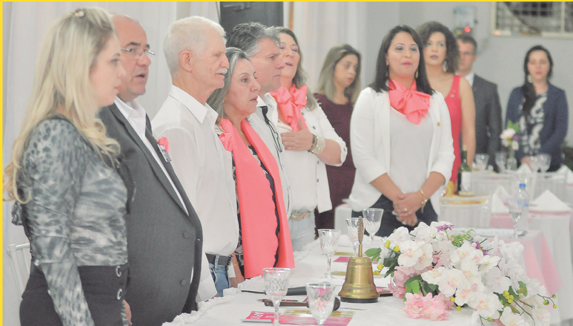
Rotarianos comandam o evento