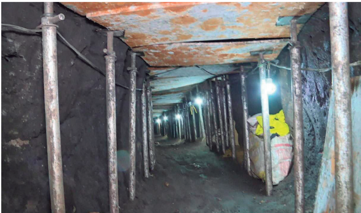
Túnel de alta complexidade construído para roubar o Banco do Brasil na Zona Sul de São Paulo