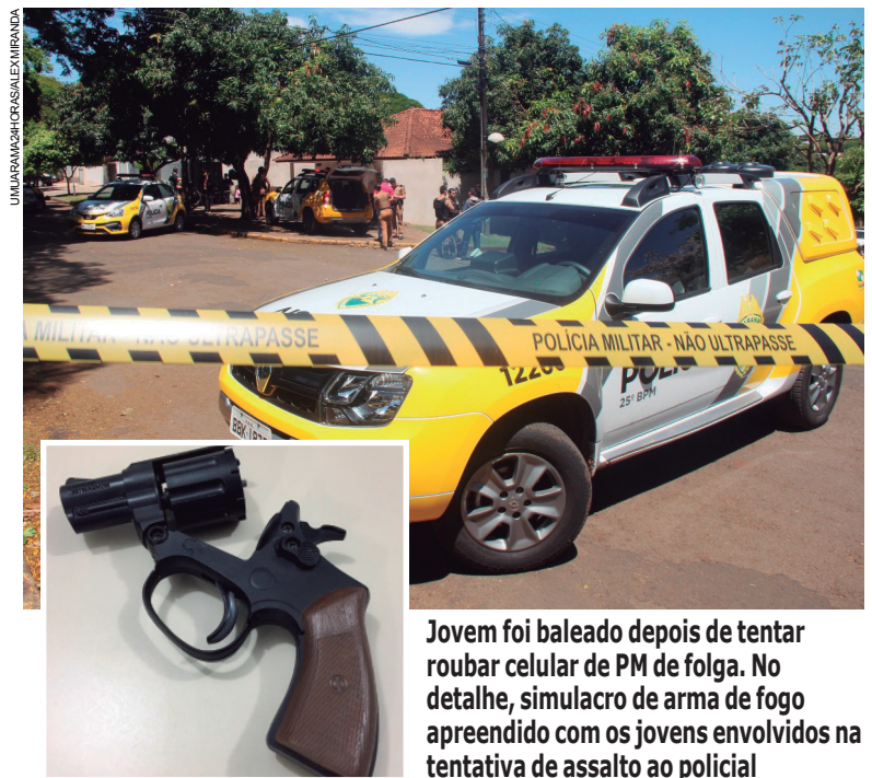
Jovem foi baleado depois de tentar roubar celular de PM de folga. No detalhe, simulacro de arma de fogo apreendido com os jovens envolvidos na tentativa de assalto ao policial