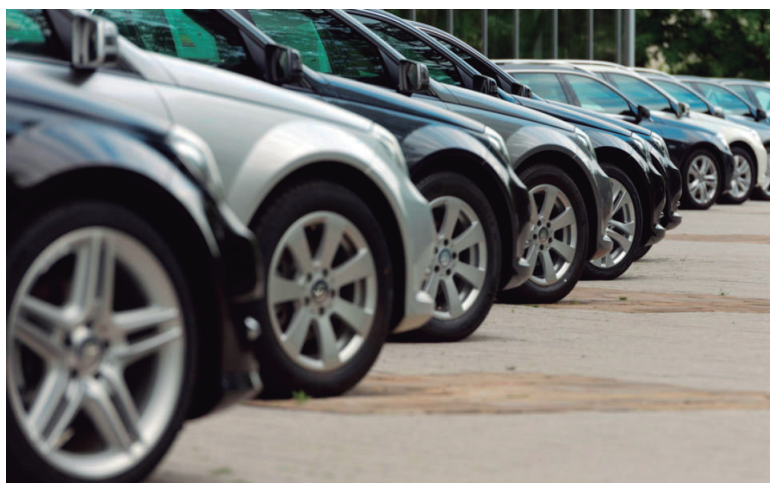
A venda de veículos novos aumentou 24,5% em setembro, indicam dados da Fenabrave

A taxa acumulada nos últimos 12 meses, no entanto, con-