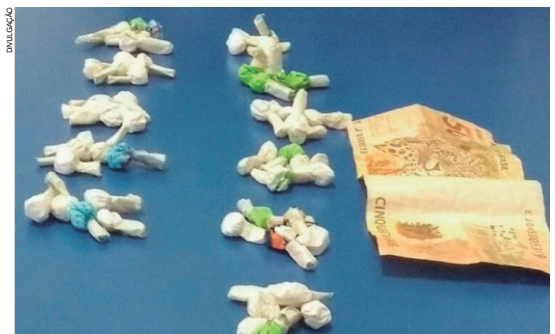
Droga apreendida pela PM no distrito de Serra dos Dourados. Cada porção seria comercializada por R$ 20

Logo depois, na Avenida Cruzeiro, numa casa que seria a moradia do suposto traficante, os policiais localizaram no interior de