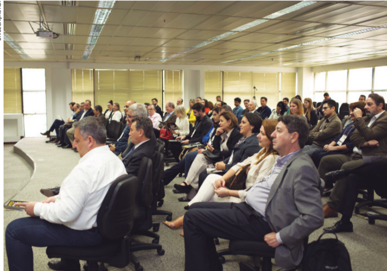
Platéia presente no seminário

os jornais, incluindo aí o de Cianorte, de sua propriedade.