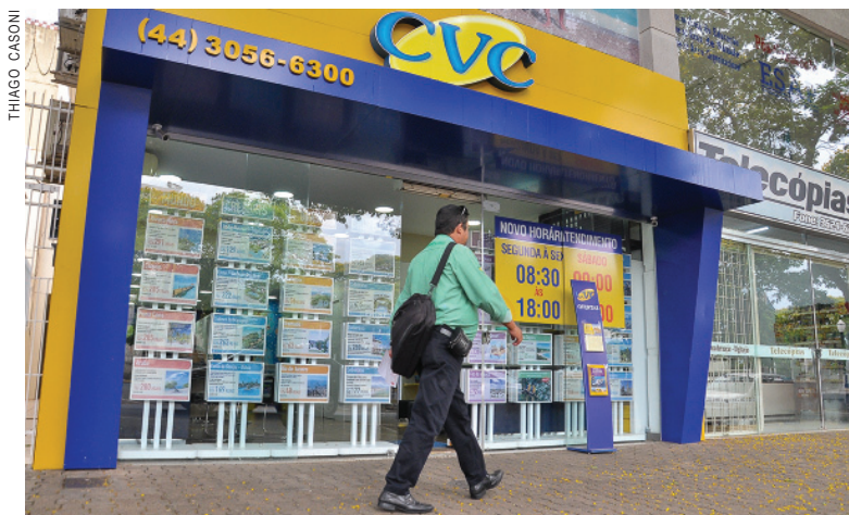
CVC de Umuarama oferece aos clientes ofertas para diversas localidades fora e dentro do país

Segundo o levantamento, o sudeste é o local do país com mais regiões turísticas englobando 1.1398 municípios. Mas de acordo com o Gerente de Vendas da Agência de Viagens CVC, Willian Molinari, o nordeste é o local mais desejado entre os umuaramenses. "Hoje a infraestrutura dedicada ao turismo no nordeste é a melhor do País. Infraestrutura de hotéis, aeropor-