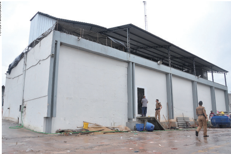
Cadeia Pública de Umuarama está interdita e não há possibilidade de receber mais presos até sua reforma

O delegado explica também que a reconstrução de uma nova cadeia é a solução mais viável, baseando-se no fator de