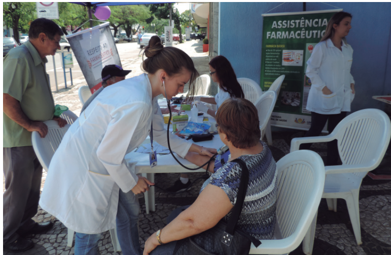
Foram oferecidos testes de glicemia capilar e aferição de pressão arterial; atendimento segue hoje

A Divisão de Assistência Farmacêutica da Secretaria de Saúde de Umuarama encerra nesta sexta-feira (29), uma campanha de arrecadação de medicamentos destinados a doação, iniciada no último dia 22. A comunidade pode levar os remédios na