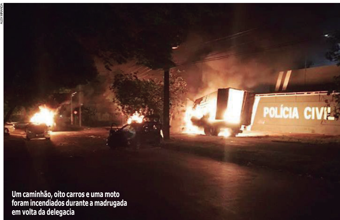
Um caminhão, oito carros e uma moto foram incendiados durante a madrugada em volta da delegacia

Mesmo assim os PMs 'seguraram a barra' e, acompanhados dos poucos investigadores que estavam por ali, manteve-