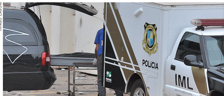
Necropsia do corpo feita em Maringá confirma que criança foi violentada e morta por asfixia

A reativação dos trabalhos no IML e no IC não tem prazo estipulado. Corpos que eventualmente tiverem que ser necropsiados deverão ser encaminhados para outras unidades regionais.