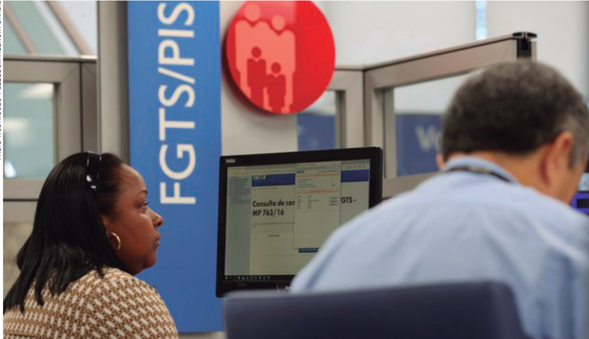
A partir desta data poderão sacar os cotistas com mais de 70 anos

a maioria tem saldo em torno de R$ 750 na conta do PIS/Pasep.