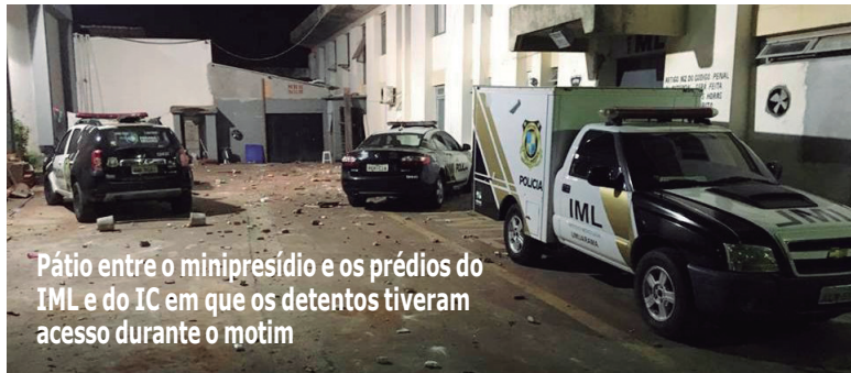
Pátio entre o minipresídio e os prédios do IML e do IC em que os detentos tiveram acesso durante o motim