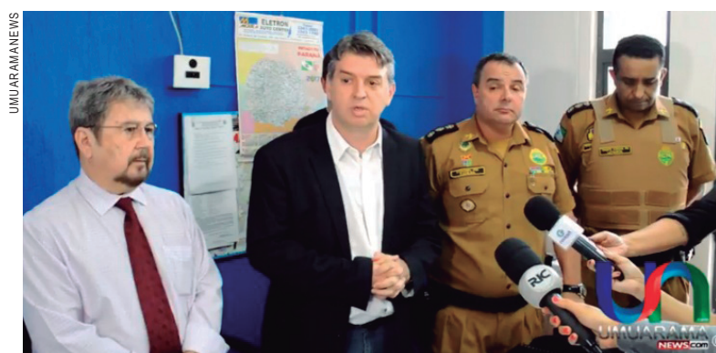
Delegado geral acompanhado do comandante da Polícia Militar do Paraná, delegado chefe da 7ª SDP e comandante da PM de Umuarama

tavam são pessoas de bem, mas alguns vândalos numa atitude incompreensível praticaram os atos que presenciamos. A Polícia agiu com absoluto alto controle para que isso não virasse uma tragédia – uma reação com armas letais seria uma tragédia. Isso não ficará impune. Vim pessoalmente para dizer que vamos instaurar um inquérito rigoroso para responsabilizar os autores destes atos", afirmou o delegado.