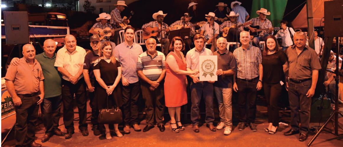
O lançamento reuniu autoridades na feira do Produtor da última quarta-feira

com a venda regularizada e um indicativo a mais de qualidade e segurança para quem optar pelas barracas certificadas”, disse.