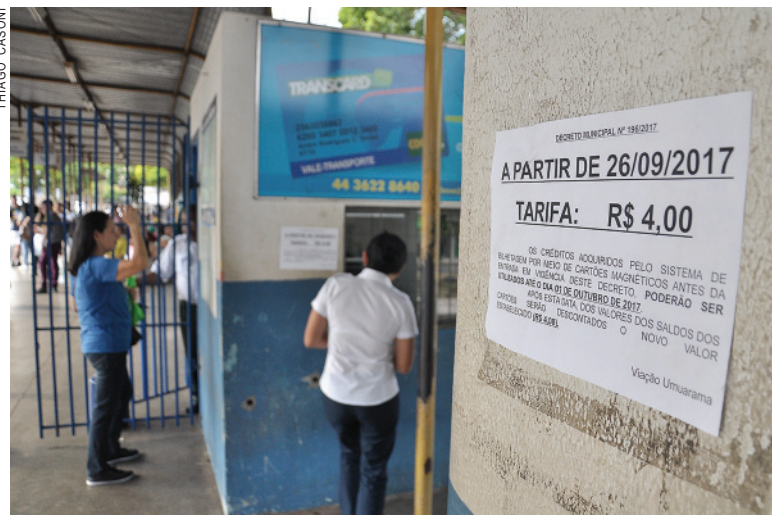
Reajuste no valor da tarifa foi comunicado aos usuários do transporte público

Segundo o diretor da Viação Umuarama, uma queda no fluxo de usuários também forçou