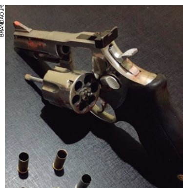
Arma utilizada pela vítima para se defender, apesar de registrada, teve que ser apreendida

O revólver de calibre 38 usado pela vítima é registrado e foi