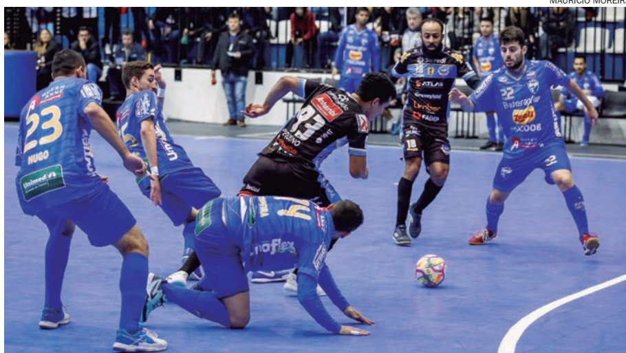
AFSU perde a hegemonia de vitória e Pato garante a liderança do Paranaense

O time de Umuarama ainda tentava virar o placar, não conseguiu fazer uma boa linha de defesa e o Pato comemorou seu quarto gol depois que Jhow, livre, mandou uma bomba pro gol de Matheus,