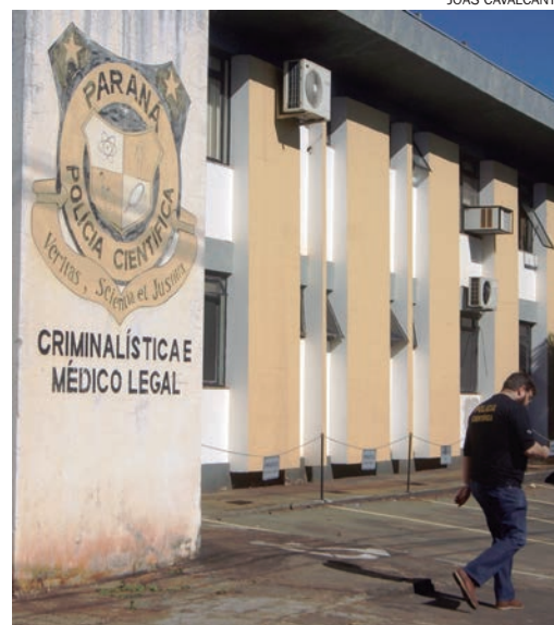
AGENTES da PF acompanharam os exames no IML de Umuarama

Uma equipe de socorristas do Samu (Serviço de Atendimento Móvel de Urgência) de Francisco Alves foi