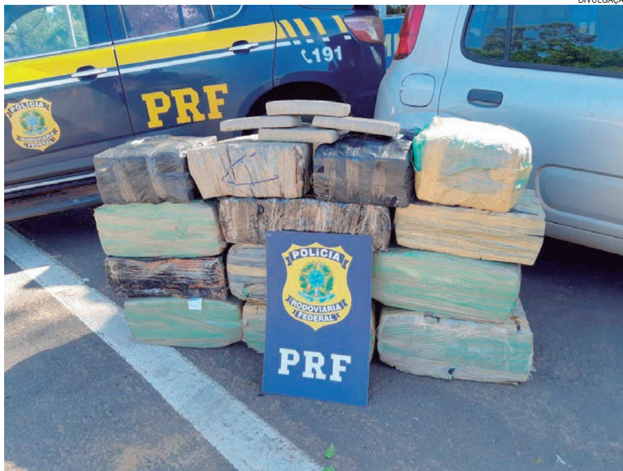
MAIS de 300 quilos de maconha apreendidos pela PRF em Alto Paraíso

A descoberta de que o carro havia sido roubado veio logo em seguida, durante uma averiguação