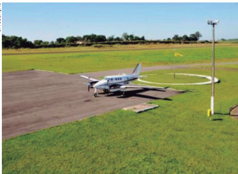
Aeroporto de Umuarama receberá o investimento de R$ 6,6 milhões

do do Plano Aeroviário do Estado, levantamento técnico da Secretaria de Infraestrutura e Logística em parceria com a Fundação de Amparo à Pesquisa e Extensão Universitária (Fapeu). O plano apresenta um panorama dos aeroportos e aeródromos públicos e as adequações necessárias para a operação e o desenvolvimento regional nos próximos 20 anos.