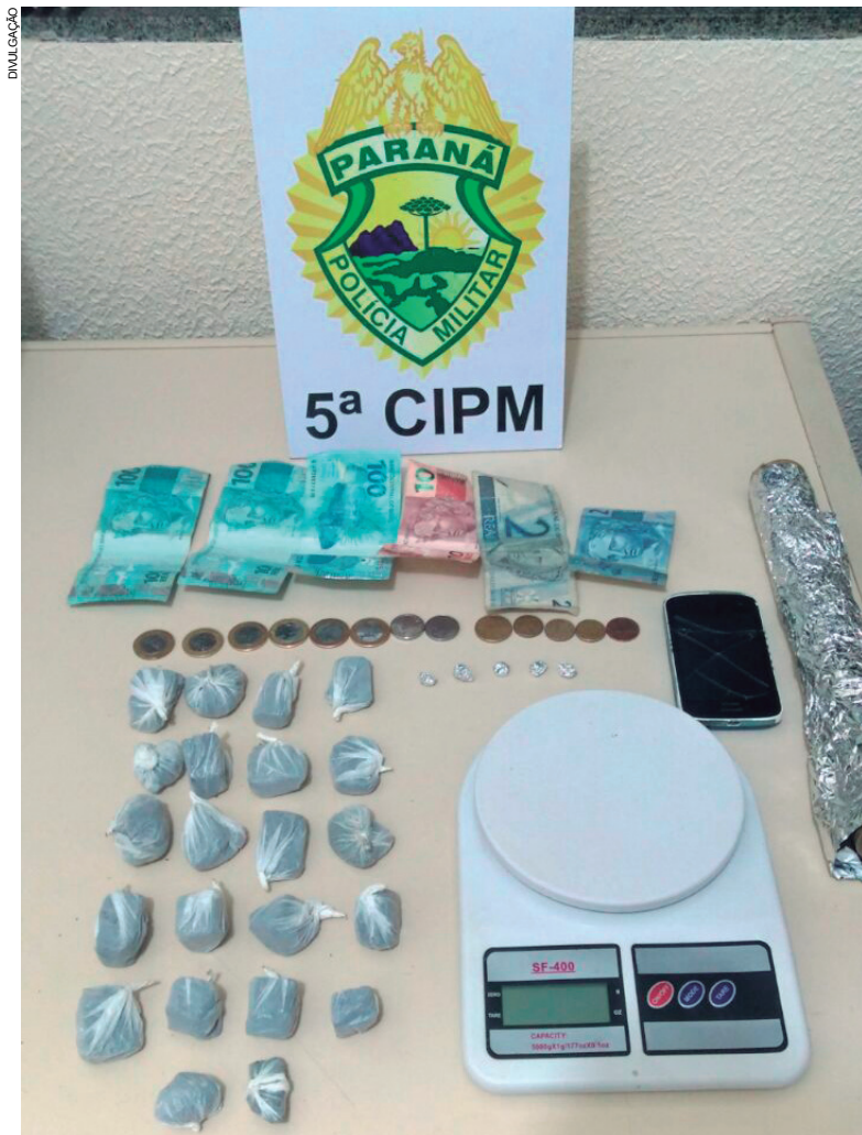
Na abordagem foram encontradas porções de maconha e crack, além de dinheiro

Durante a abordagem, um homem, de 44 anos, entrou na residência. Ao ser questionado, informou que havia retornado ao local para resgatar sua carteira, a qual ele teria entregou como forma de pagamento no dia anterior em troca de duas pedras de crack. Os dois envolvidos, os materiais e os entorpecentes apreendidos foram levados à delegacia para que as medidas necessárias fossem adotadas.