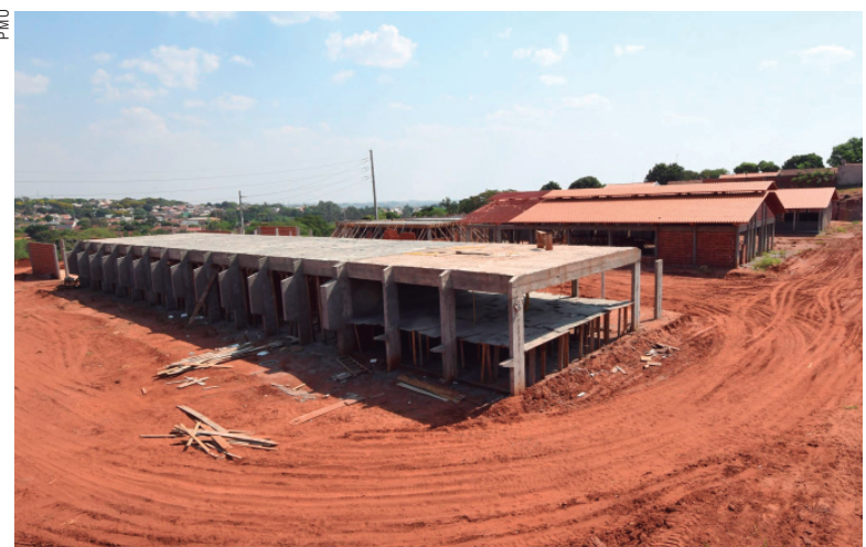
No total, a obra possui mais de 3 mil metros e está recebendo o investimento de R$ 3,6 milhões