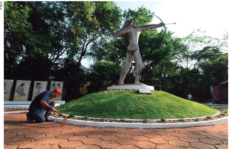
Servidores adequaram o espaço para a ação desta quinta-feira