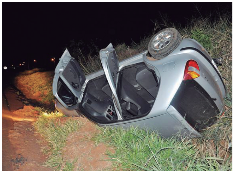
Durante a perseguição, o condutor do veículo perdeu o controle e o veículo capotou

Um veículo Palio que foi tomado de assalto em Goioerê na noite de segunda-feira (18), tom-