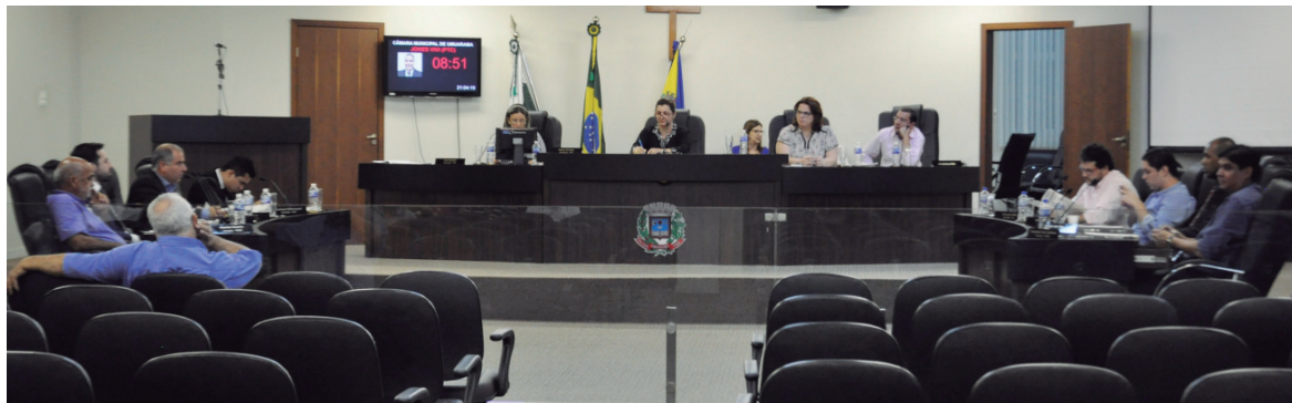
Cinco projetos foram aprovados na sessão da última segunda

Nesta segunda-feira (18), a sessão ordinária da Câmara Municipal de Umuarama teve em sua pauta cinco projetos abertos à apreciação e votação dos vereadores. Além dos projetos, estava ainda em pauta a Moção Nº 02/2017, prestando apoio ao Ministro da Agricultura, Blairo Maggi, em virtude de sua atuação voltada à preocupação com os produtores de Leite no Brasil.