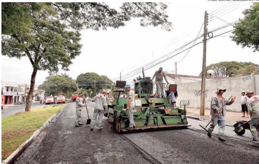
MÁQUINAS e funcionários trabalhando no trecho para recuperação da via