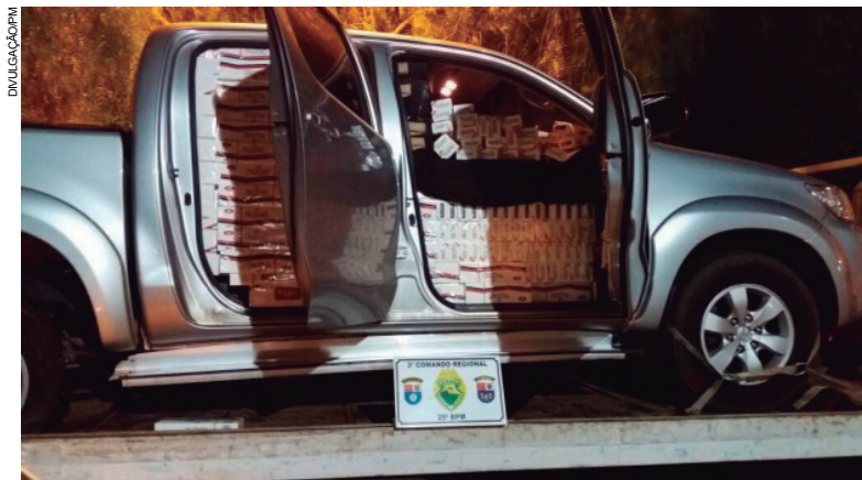
S10 prata com diversas caixas de cigarro contrabandeado