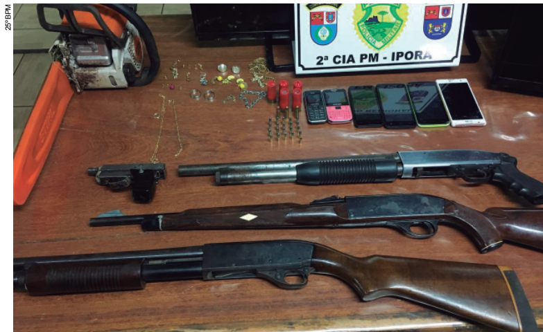
Armas de fogo, munições e objetos provenientes de crimes foram recuperados

A abordagem dos golpistas à vítima foi na manhã da quarta-feira. O flagrante aconteceu após o filho da mulher ficar sabendo que ela tinha tentado sacar dinheiro e avisou a equipe da PM. Policiais abordaram os golpistas em flagrante na Rua José Geraldo de Souza, na esquina com a Escola Ribeiro de Campos, depois de a vítima sair da agência bancária. O objetivo era conseguir R$ 10 mil da idosa.