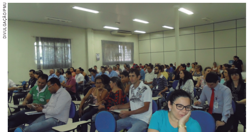
Na reunião estiveram presentes diversas pessoas portadores de deficiência, empresários, lideranças representativas

Para o diretor da Agência do Trabalhador, a reunião preparatória foi muito bem organizada e superou as expectativas, tanto pelo interesse e participação dos beneficiários como também pela importante parceria para a realização do evento do dia 29. “Precisamos nos colocar a serviço da população e entregar