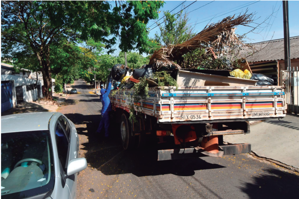
Uma empresa foi contratada para o serviço de coleta em todos os bairros residenciais da cidade

cos e deixe com a boca fechada, amarrada, para agilizar a coleta. Os galhos podem ser depositados junto com as folhas ensacadas. Mas não misture esse tipo de resíduo com o lixo doméstico nem o reciclável”, disse, mais uma vez.