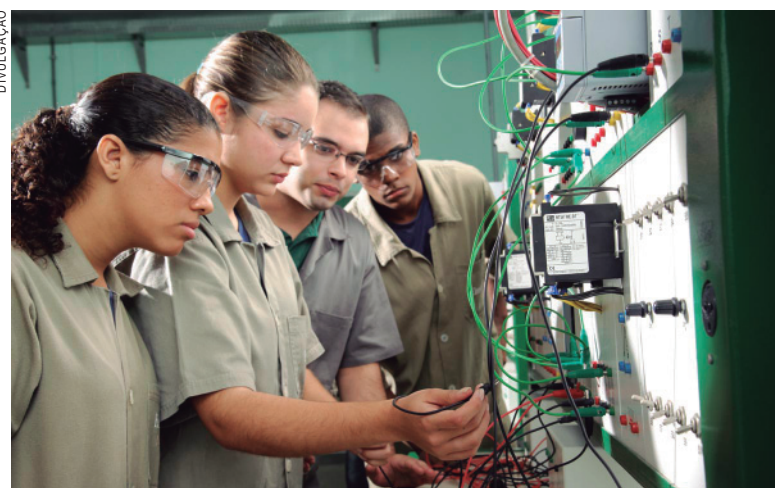
Candidatos com nível técnico podem ter mais chances de recolocação no mercado

O número de vagas de trabalho com carteira assinada cresceu em julho. Conforme o Caged, do Ministério do Trabalho e Emprego, houve crescimento de 35.900 postos de trabalho - resultado de 1.167.770 admissões e de 1.131.870 desligamentos.