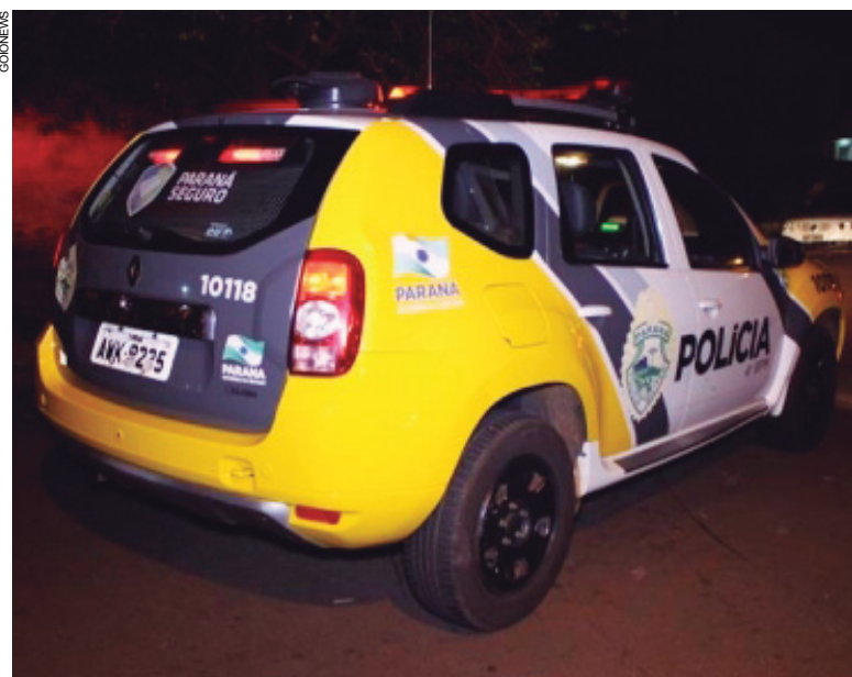
Caso aconteceu quando a PM realizava patrulhamento e encontro dois indivíduos em atitude suspeita

Os policiais revidaram e efetuaram dois disparos, um deles acertou a perna esquerda do suspeito. Ele estava com um revólver marca Bulldog, calibre 44,