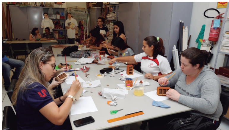
Oficinas enriquecem aprendizado acadêmico

Palestras, mesa-redonda, gincana, oficinas, apresentação de trabalhos e atividades recreativas e culturais guiaram a 25ª Semana de Estudos Pedagógicos, promovida pelo curso de Pedagogia da Universidade Paranaense – Unipar, em Umuarama. O 14º Encontro de Pedagogos da Região Noroeste Paranaense integrou a programação. Este ano o eixo temático da Semana foi Ações Educativas Recreativas, Éticas e Estéticas. Na abertura, um grupo de estudantes do curso encantou o público com apresentações artísticas.