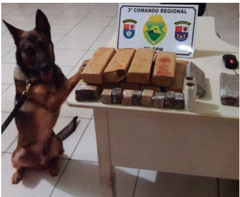
Oito quilos e meio de maconha encontrado pelo cão farejador da polícia

O entorpecente foi entregue à 7ª SDP de Umuarama.