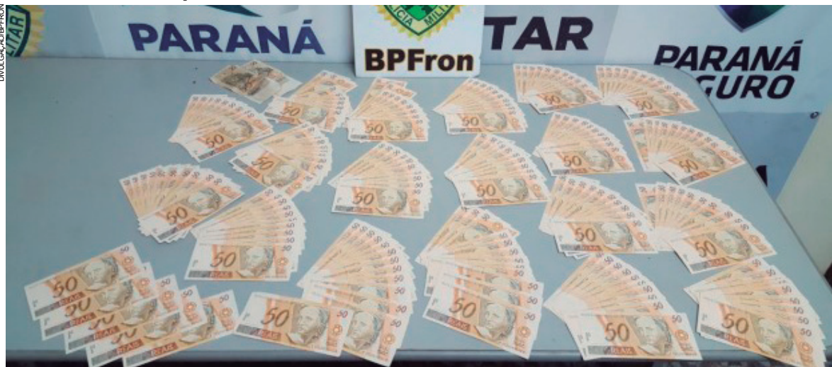
Policiais localizaram 202 cédulas falsas de R$ 50

Um homem foi preso dentro de um ônibus que faz a linha Guaíra-Londrina na noite desta segunda-feira (11), no centro de Guaíra. Sob sua poltrona, policiais militares do BPFron (Batalhão de Frontei-