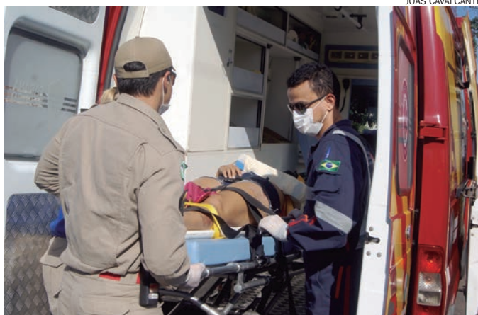
MULHER ferida foi socorrida às pressas pelos bombeiros e pelo Samu

Uma motocicleta Honda CG 150, com placa de Terra Roxa, era conduzida por um jovem que não foi identificado. Ele trafegava pela rua Nossa Senhora Aparecida, no sentido à rua Anhumai quando uma Honda Biz, pilotada por