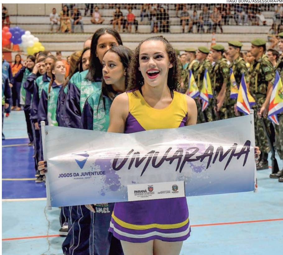
DELEGAÇÃO de Umuarama foi a mais aplaudida ao entrar no ginásio

O público também foi apresentado com uma apresentação da equipe de ginástica rítmica da Unipar e com o time dos Tigres de Umuarama, atual campeão