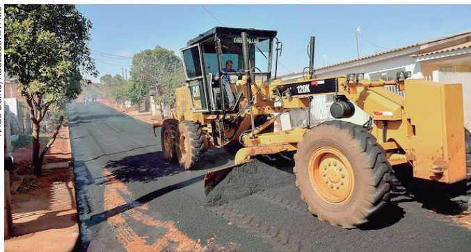
PARTE das vias recebeu capa asfáltica e trechos restantes serão asfaltados

realizando essa melhoria com recursos do município e mão de obra própria, o que permite reduzir os custos e atender a população com mais agilidade, desde que recuperamos a capacidade de trabalho com a aquisição de tratores, máquinas e outros implementos para o pátio”, lembrou o prefeito.