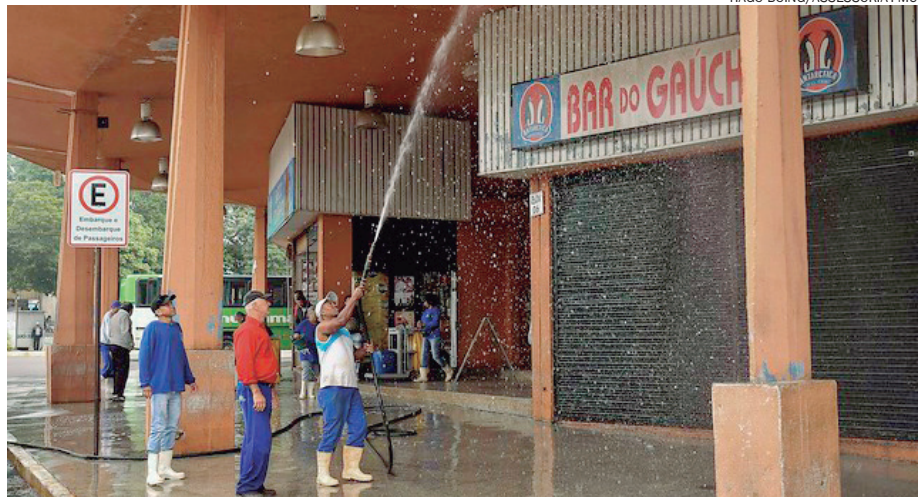
EQUIPES da Secretaria de Serviços Públicos deram um 'limpa' na rodoviária

A limpeza ocorreu num curto período de tempo, sem causar problemas aos clientes do comércio local, passageiros e demais frequentadores. “A ação foi realizada no fim de semana, visando o bem-estar de todos que por ali passam