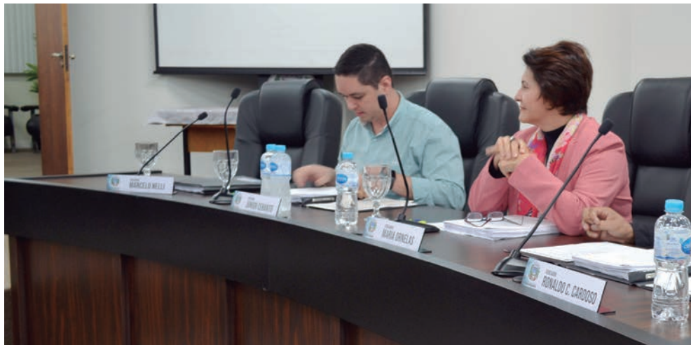
CADEIRA vazia do vereador que não compareceu à primeira sessão ordinária após o recesso