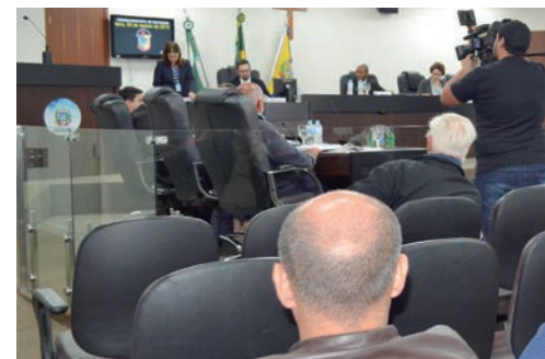
VEREADORES discutiram e votaram proposições norm