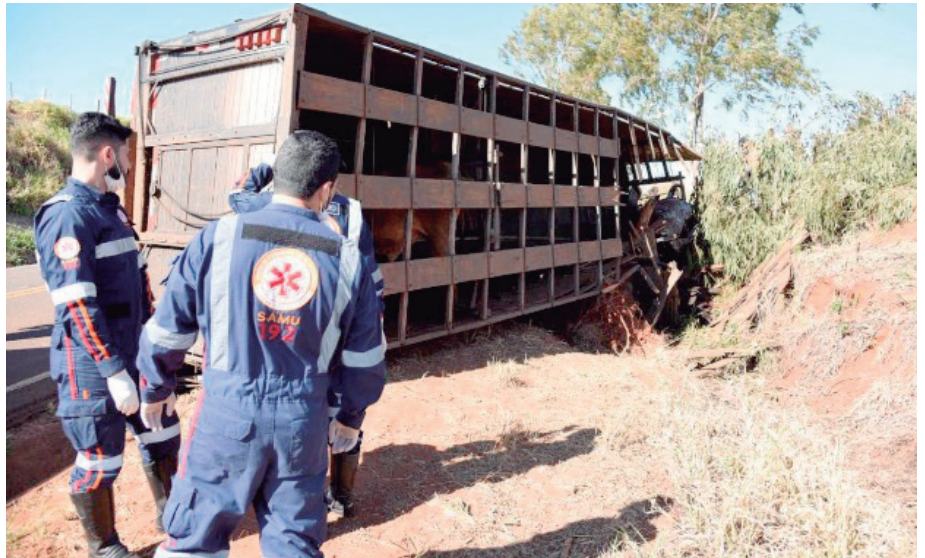
CORPO de caminhoneiro ficou preso às ferragens do veículo e foi retirado pelos bombeiros

O corpo do caminhoneiro ficou preso às ferragens, sendo retirado pelos bombeiros de Umuarama. Uma