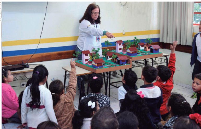
Agentes da Vigilância Ambiental orientaram alunos com maquetes de cidade limpa e suja