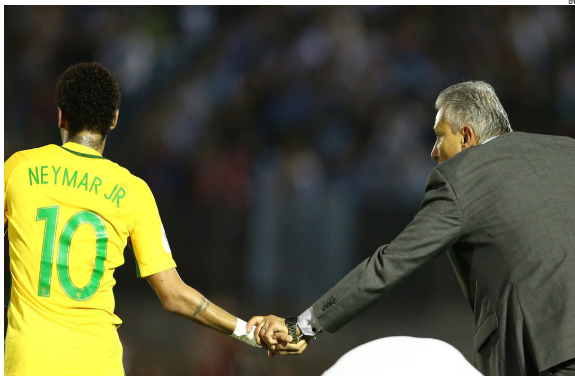
Técnico Tite foi lembrado por sua campanha com a seleção brasileira