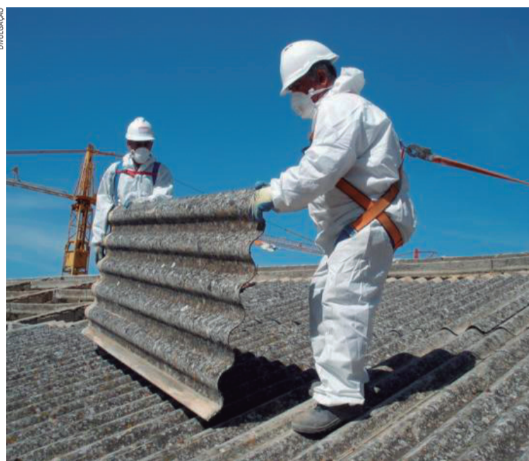
Amianto é uma fibra mineral usada na fabricação de telhas e demais produtos, estudos comprovam que a substância é cancerígena e causa danos ao meio ambiente

Os ministros julgam ainda a validade das normas estaduais que contrariam a Lei Federal