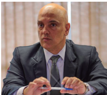
Ministro do Supremo Tribunal Federal, Alexandre de Moraes

Questionado sobre o assunto, Moraes disse que deve deci-