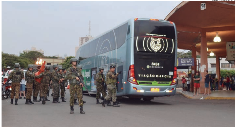
MILITARES averiguaram pessoas e ônibus que chegavam da região de fronteira

Na manhã de ontem, os militares da 15ª Brigada de Infantaria Mecanizada estiveram nas rodovias da região, onde