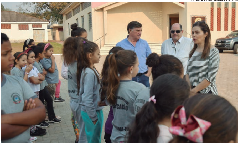
ALUNOS de escolas municipais e da Apae plantaram mudas de flores e plantas ornamentais e tiveram aulas de campo

“É um trabalho muito bonito falar às crianças sobre meio ambiente, a preservação e como as plantas podem mudar o ambiente onde vivemos para melhor”, disse o prefeito Celso Pozzobom, que acompanhou a