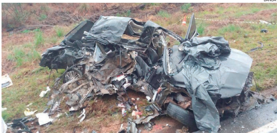
VEÍCULO em que os umuaramenses estavam ficou completamente destruído

através dos relatos da Polícia Rodoviária, pela forma em que o acidente aconteceu, um dos veículos teria invadido a pista contrária. Chovia muito no momento da colisão. Equipes da PRF se deslocam