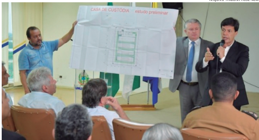
PROJETO da casa de custódia chegou a ser apresentado às autoridades políticas e de Segurança Pública em Umuarama

O governador destacou que assumiu o Estado com o maior número de presos em delegacias do País e salientou que isso precisa ser equacionado para promover tratamento penal adequado e