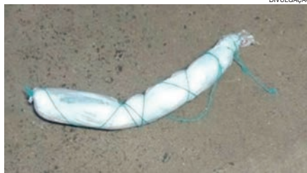
EMULSÃO de dinamite apreendida foi colocada à disposição do Bope

Segundo levantamentos feitos por agentes de cadeia, os presos utilizariam os explosivos com para detonar uma das paredes e empreender uma fuga em massa. Diversas medidas de segurança tiveram que ser adotadas pelo Depen, que à partir daí agiu em