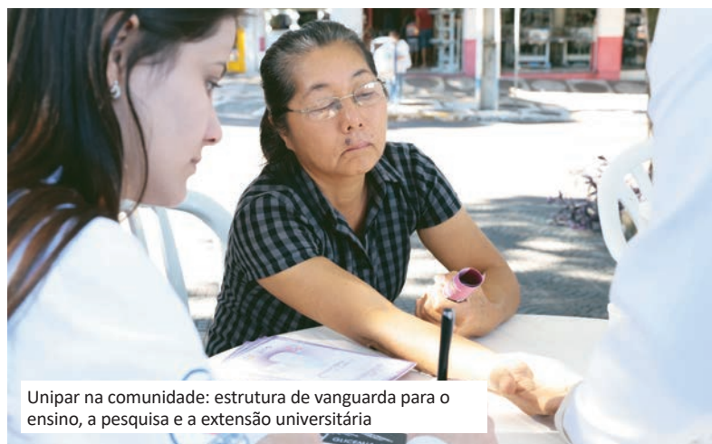
Unipar na comunidade: estrutura de vanguarda para o ensino, a pesquisa e a extensão universitária

NOVIDADES – Quatro cursos novos na Unipar Câmpus Umuarama, na modalidade presencial: Gestão de RH, Marketing, Processos Gerenciais e Terapia Ocupacional.