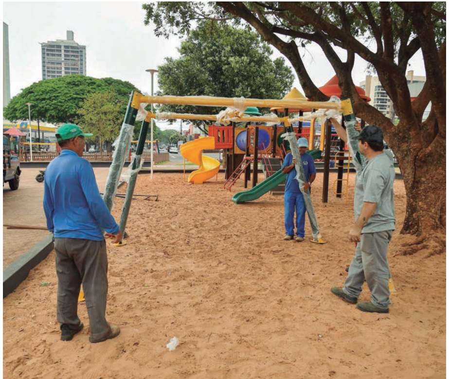
A Prefeitura ampliou o espaço do parquinho, que recebeu mureta, bancos em concreto e areia para o lazer e diversão das crianças

A Secretaria de Obras, Planejamento Urbano e Projetos Técnicos ampliou o espaço do parquinho, que recebeu mureta, bancos em concreto e areia para o lazer e diversão das crianças. “Ali os pais podem acompanhar os filhos de perto. A areia deixa as crianças mais à vontade e reduz os riscos de ferimentos, em caso de aciden-