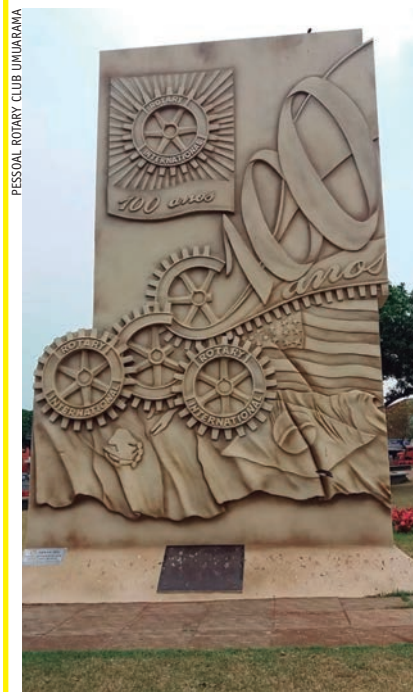
PESSOAL ROTARY CLUB UMUARAMA