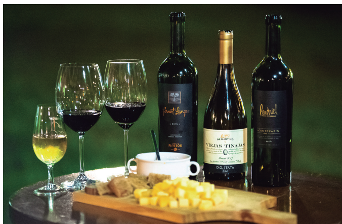
Vinhos da noite: Chilenos & Argentinos