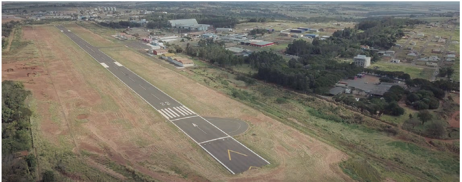
AEROPORTO está em fase de finalização para que possa solicitar à Anac a Certificação para voos comerciais

para que o aeroporto inicia seu funcionamento com voos comerciais. Ele rebateu as denúncias feitas pelo deputado, de que o aeroporto, considerado em sobrestado para voos comerciais, não recebeu a certificação da Anac (Agência Nacional de Aviação Civil).