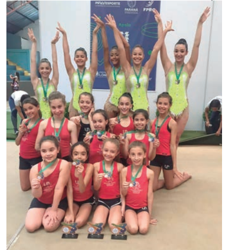
A equipe Umuaramense conquistou medalhas no Paranaense em Londrina