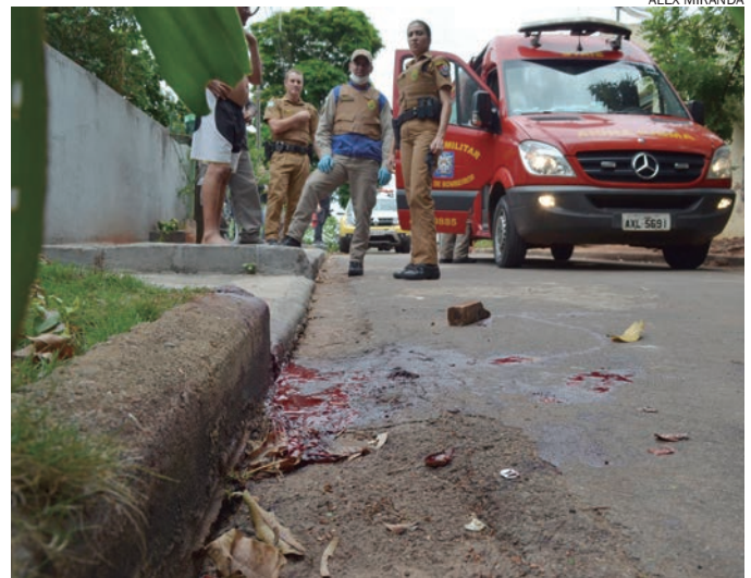
NO asfalto, a poça de sangue depois que o homem foi alvejado com um tiro na mão

Conforme o soldado Bortolucci do Corpo de