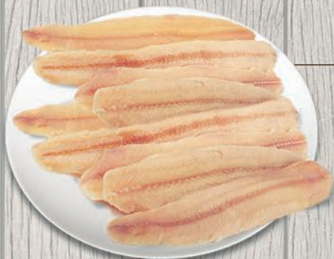
FILE DE MAPARÁ