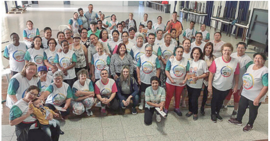
PROGRAMA oferece atividades recreativas, alongamento, circuito funcional, ginástica aeróbica e passeios para homens e mulheres acima dos 60 anos