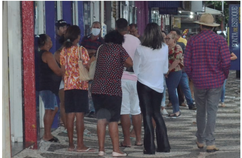
COM a reabertura do centro comercial em Umuarama, ruas ficaram lotadas, principalmente nos bancos e nas lotéricas

O decreto mantém a situação de emergência em Umuarama desde 20 de março e autoriza a abertura ao público da indústria e de grande