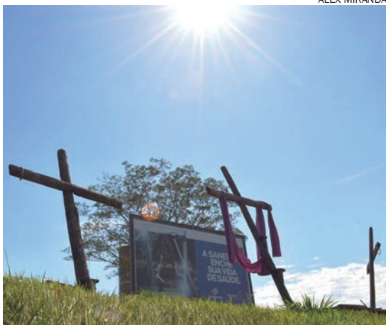
PEÇA Paixão de Cristo, apresentada anualmente no “Morro das Antenas” foi cancelada por causa da pandemia

A Missa “da Ceia do Senhor” e da instituição da Eucaristia, na Quinta-Feira Santa, passado o pôr do sol: os Padres celebrarão em privado e transmitirão ao povo. A cerimônia de Lava-Pés e a adoração eucarística presencial não acontecerão. O próprio Padre, porém, ficará por algum tempo após a missa, em oração diante da Eucaristia, colocada no tabernáculo (não no ostensório). A adoração será transmitida, com o convite para que o povo a acompanhe em suas casas o rico momento de expressar a ‘comunhão’ com o Padre em torno de Jesus, ‘vigilando com Ele’, como os apóstolos no Horto das Oliveiras.