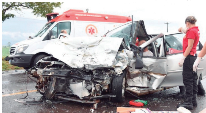
VIOLENTA colisão deixou duas pessoas feridas e tirou a vida de outras duas nas proximidades de Perobal

No Vectra estava o motorista e outra pessoa.