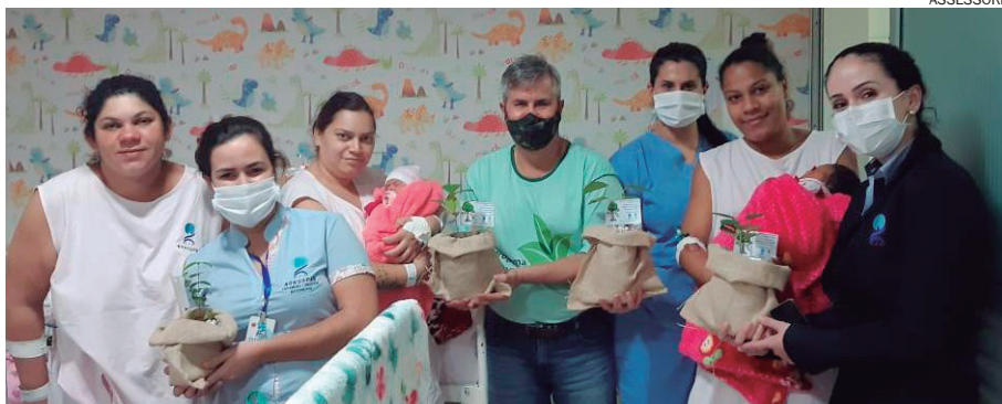
FORAM entregues aos colaboradores e às pacientes da Maternidade Regional um total de 120 mudas de árvores frutíferas e ipês

Para a prática da sustentabilidade, os colaboradores também receberam garrafas e canecas ecológicas para reduzir o uso de copos descartáveis dentro da instituição. A Norospar realiza diversas ações relacionadas a preservação e cuidado com o meio