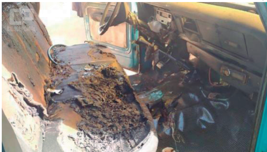
CABINE da caminhonete estava sendo consumido pelas chamas

Em seguida, foi mantido contato com o Delegacia de Polícia de Perobal. A Polícia Militar também foi informada a respeito do caso e deram continuidade à ocorrência.