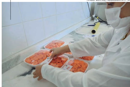
EMBALAGENS com alimentos doados pelo Planalto e Cidade Canção são processados por estagiários de Tecnologia em Alimentos e Nutrição da Unipar e da UEM

O texto aprovado, também com quatro votos contrários, altera o percentual de desconto nos subsídios dos servidores públicos municipais, inclusive inativos, que, de 11% passa a ser de 14%, conforme previsto pela Emenda Constitucional supracitada, assim que a Lei for sancionada pelo prefeito Celso Pozzobom.