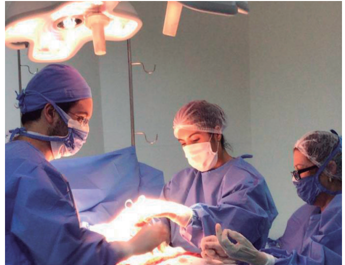
A captação dos rins durou cerca de 3 horas e foi realizada pela CIHDOTT e pela equipe de captação e transporte de órgãos da Santa Casa de Maringá

A captação durou cerca de três horas e terminou por volta da meia noite desta terça-feira (23) e o corpo foi liberado para as homenagens da família.