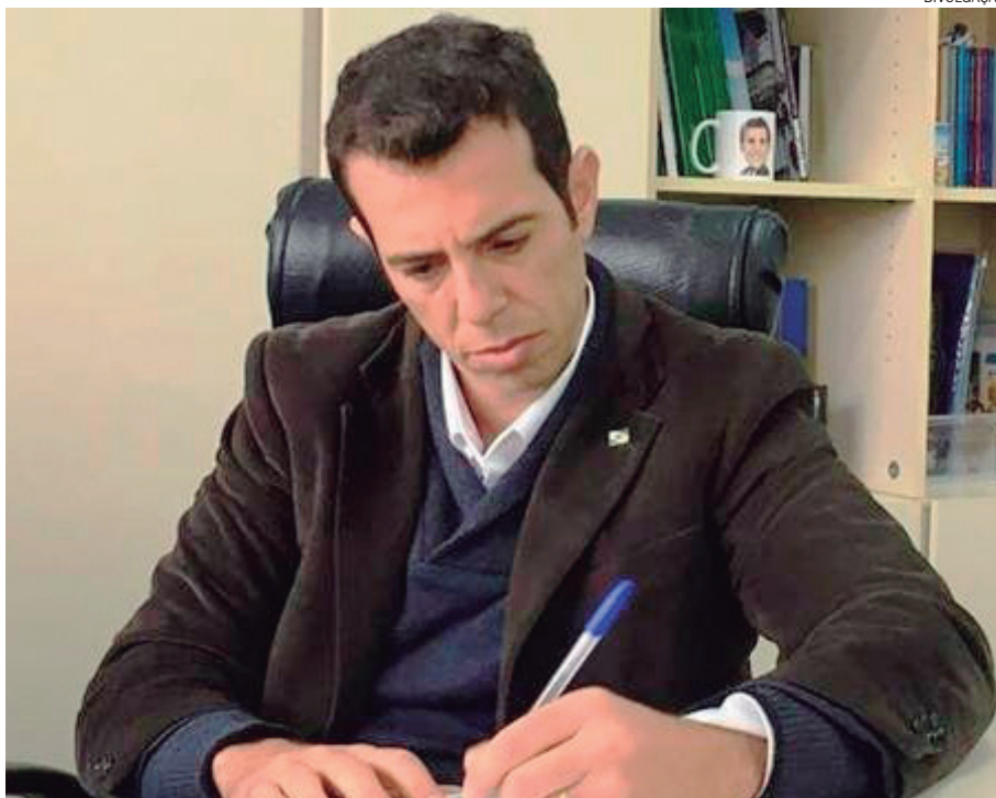
FEDER saiu da reunião com Bolsonaro sem nenhuma definição oficial se assumiria o cargo