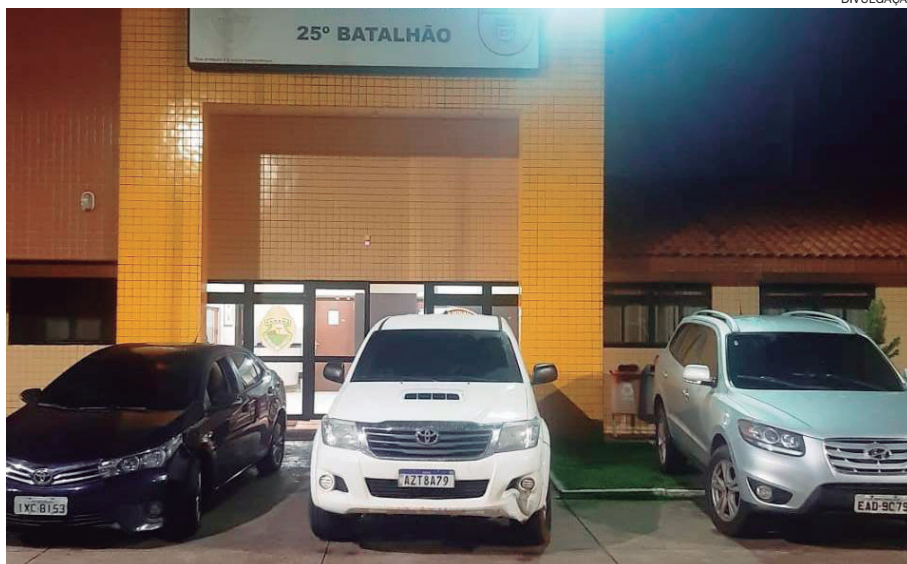
TRÊS veículos apreendidos em ações distintas da Polícia Militar. Dos deles levavam contrabando

Numa revista, os policiais encontraram 35 caixas de cigarros do Paraguai e um radiotransmissor em seu interior. O motorista foi preso em flagrante e encaminhado, junto com o carro e cigarros, para a Delegacia