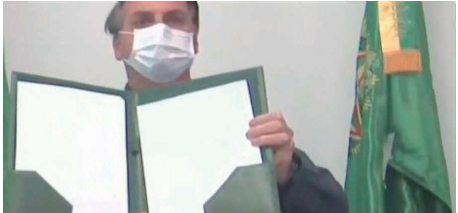
PRESIDENTE vetou prontos que serão posteriormente analisados pelo Senado

“Esperamos que haja R$ 600, R$ 700 bilhões de investimentos nos próximos anos nesse setor. São 100 milhões de brasileiros que não podiam lavar as mãos. Na verdade, 100 milhões sem esgoto e falta de água limpa para 35 milhões de brasileiros. Então, é importante e isso destrava, porque é a primeira grande onda de investimentos”, disse o ministro. Bolsonaro participou da cerimônia por videoconferência. Ele está com Covid-19 e por isso tem trabalhado na residência oficial do Palácio da Alvorada. Bolsonaro não discursou.