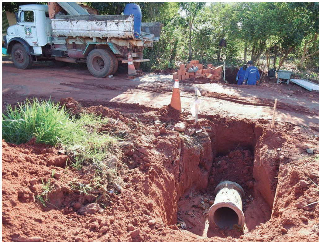
O trabalho foi iniciado na última segunda-feira e deve ser concluído ainda nesta semana