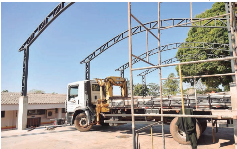
NA Escola São Cristóvão, o investimento é de R$ 423.791,71 e a obra tem previsão de entrega para o final de agosto

Outros estabelecimentos estão recebendo pintura nova e reparos, já em fase de acabamento, como as Escola Malba Tahan e os CMEIs