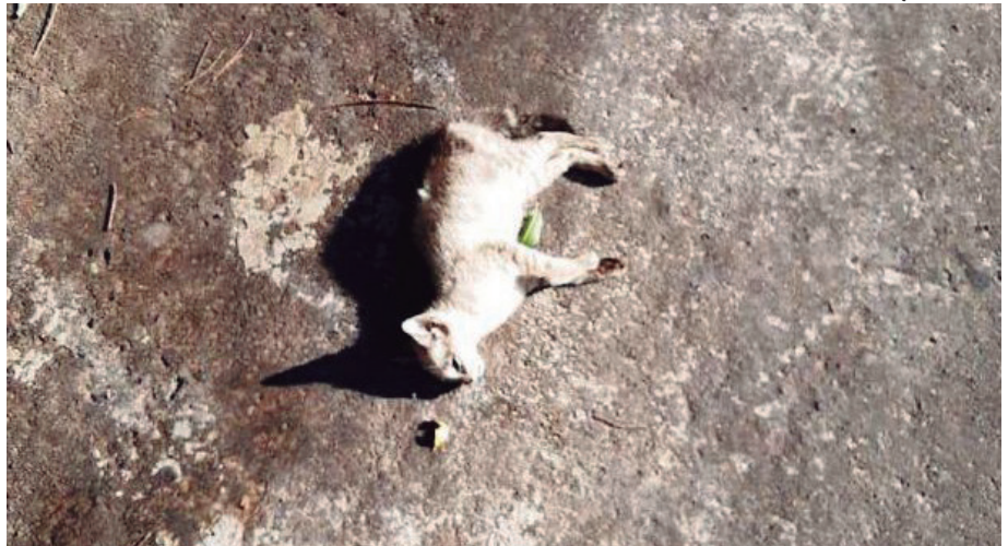
UM dos cinco gatos envenenados, que foi encontrado morto no Jardim das Garças

Fabiana lembra que um dos animais envenenados, foi encontrado morto num terreno baldio em frente sua residência. Ela fotografou o