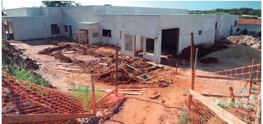
A unidade é uma das 20 que o Governo do Estado constrói ou moderniza em cidades com mais de 80 mil habitantes

O projeto é anterior ao programa estadual, mas o governo contribui atualmente