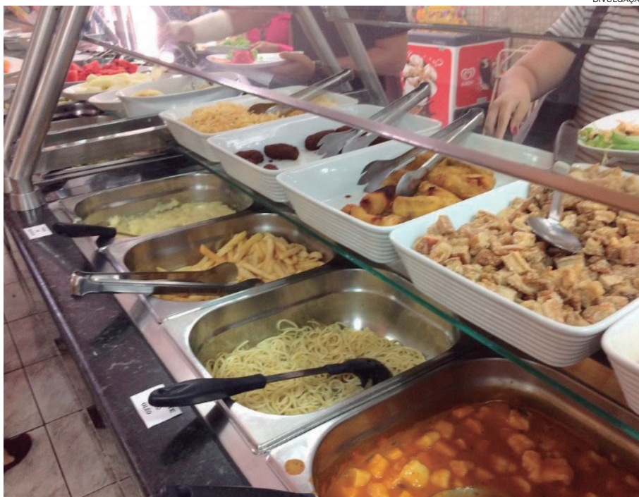
PROJETO visa manter estes estabelecimentos funcionando durante a pandemia

Devido ao impacto econômico gerado às pequenas empresas desde o início da pandemia, muitos empresários deste e de outros seguimentos, encerraram suas atividades e alguns estão à