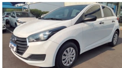
HB20 1.0 COMFORT 18/18, BRANCO, COMPLETO R$ 43.9000,00