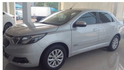
COBALT ELITE 18/19, PRATA, COMPLETO, AUT. R$ 63.9000,00