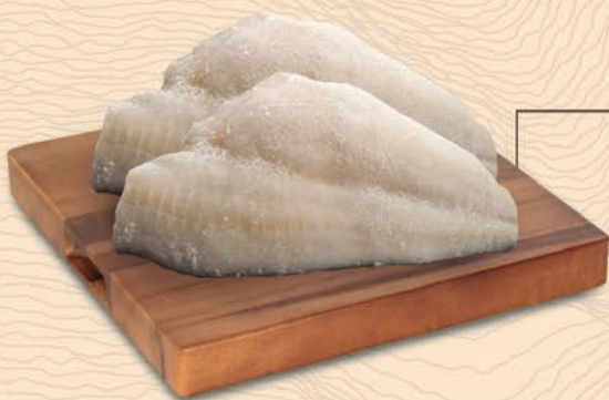
FILE DE LINGUADO