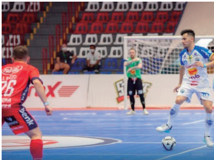
MESMO perdendo a partida, o time de Futsal de Umuarama está em terceiro no grupo C