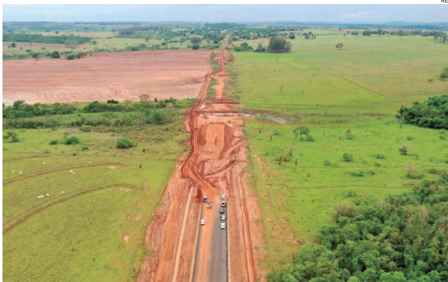
OS recursos serão para a implantação, reparação, restauração e pavimentação em 47 km entre Icaraíma e Umuarama, e deve estar pronto até 2022

A Itaipu informa que a BR-487 não está na área de abrangência da usina, mas faz parte da bacia do Rio Ivaí, que desemboca no Rio Paraná e é importante pela sua contribuição ao reservatório da hidrelétrica. Para viabilizar a obra,