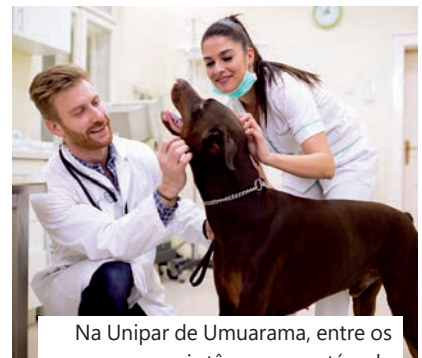
Na Unipar de Umuarama, entre os cursos que mais têm vagas está o de Medicina Veterinária

Aproveite a oportunidade, financie seus estudos, conquiste seu diploma e comece a pagar só depois de se formar.