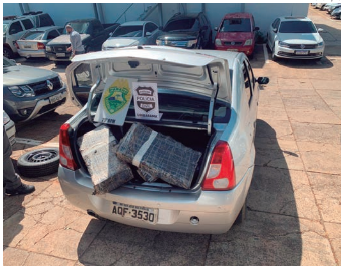
DROGA apreendido no veículo, foi levada à delegacia de Umuarama

Equipes das Polícias Civil e Militar de Umuarama apreenderam 206,9 quilos de maconha na tarde de ontem (quinta-feira, 19), após uma perseguição pela rodovia PR-323, entre Perobal e Umuarama. Foi necessário que os policiais disparassem tiros contra o veículo em fuga, para tentar forçar uma parada.