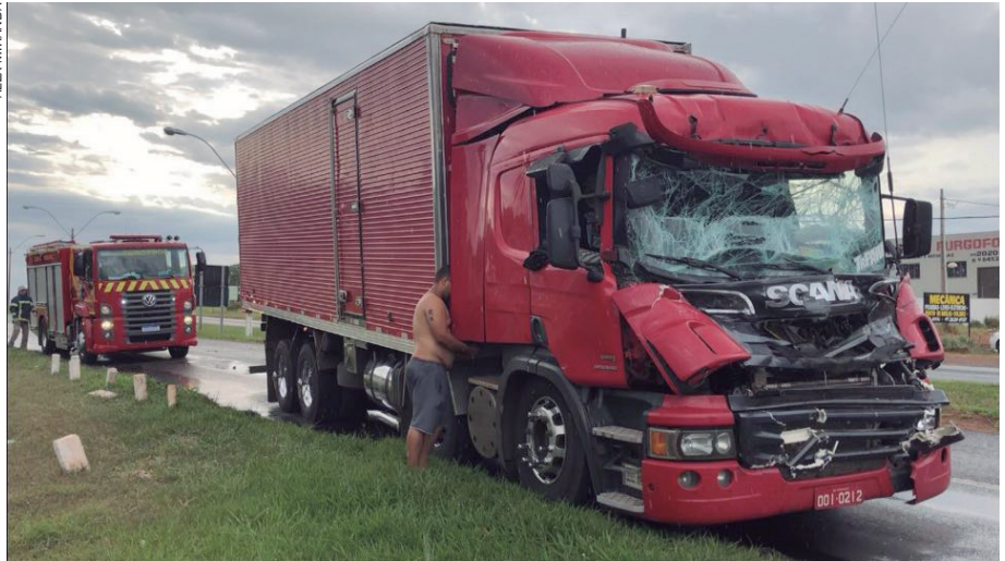
Colisão traseira na rodovia PR 323 destruiu cabine. Motorista não se feriu