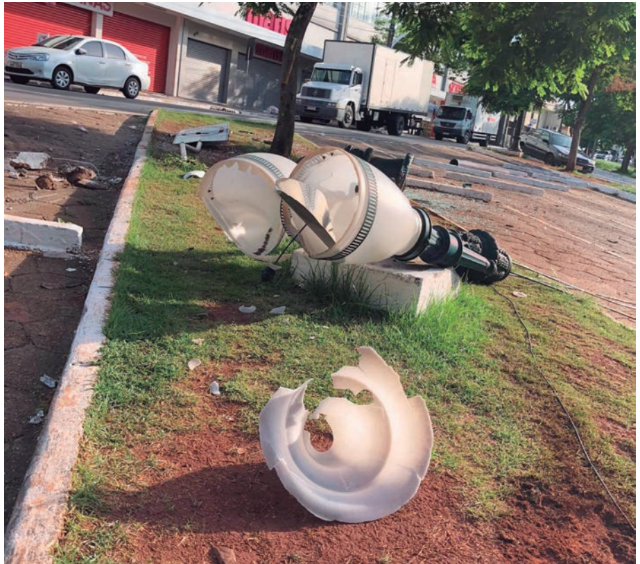
POSTE colonial de iluminação foi arrancado da base, bem como uma placa de sinalização de trânsito

Aparentemente não houve registro de feridos e nem mesmo o Departamento de Trânsito da Polícia Militar de Umuarama foi acionado para atender ao caso.