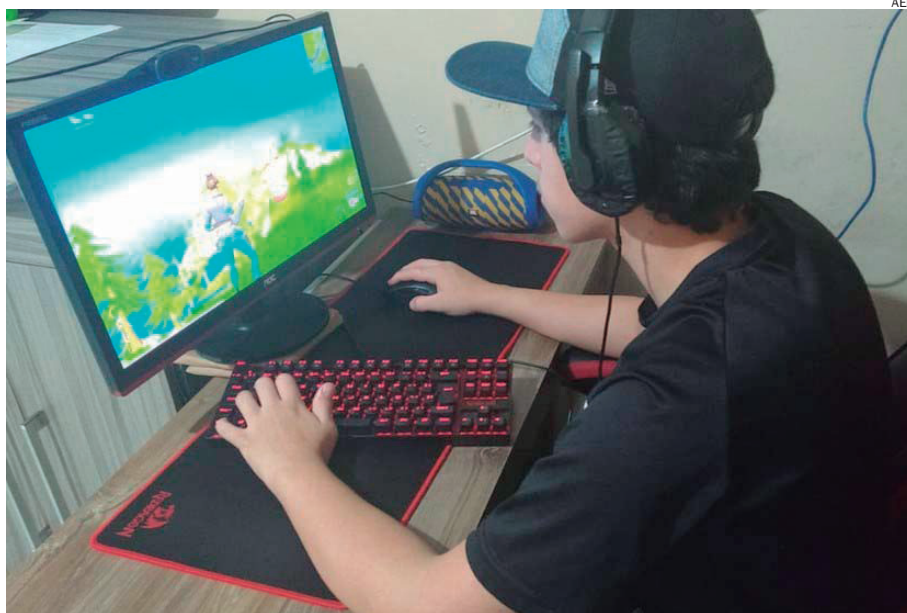
A primeira edição foi exclusiva para estudantes de 14 a 18 anos matriculados em escola regular e com residência comprovada no Paraná

“Essa iniciativa com os estudantes do Estado tornará o Paraná um grande polo brasileiro de evolução de e-sports, trazendo o desenvolvimento de esportes da mente com a participação de grandes talentos e, acima de tudo, incentivando um nicho de negócio, emprego e renda”.