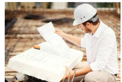
Engenharia, um dos cursos disponíveis neste processo seletivo.

São mais curtos, mais acessíveis que os presenciais e semipresenciais, mas com toda garantia e alto nível que só uma universidade do gabarito da Unipar pode oferecer.